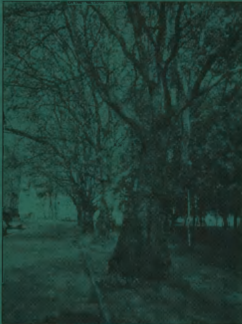
Słupskie platany / Platanus acerifolia / - - pomniki przyrody przy Placu Powstańców Warszawy