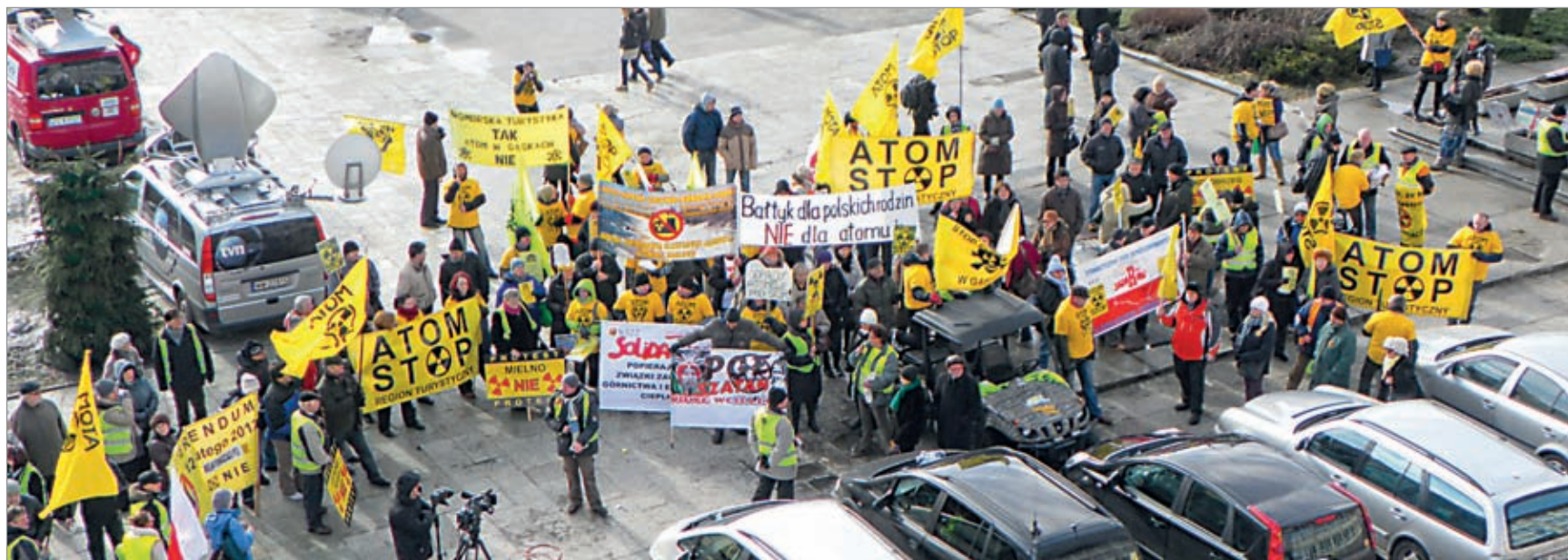
Ubiegłotygodniowa demonstracja elektrowni atomowych przed ratuszem w Koszalinie. protestowali w niej także mieszkańcy gminy Choczewo.