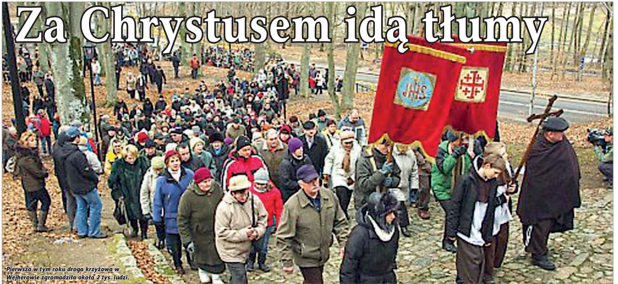
Pierwsza w tym roku droga krzyżowa w Wejherowie zgromadziła około 2 tys. ludzi.