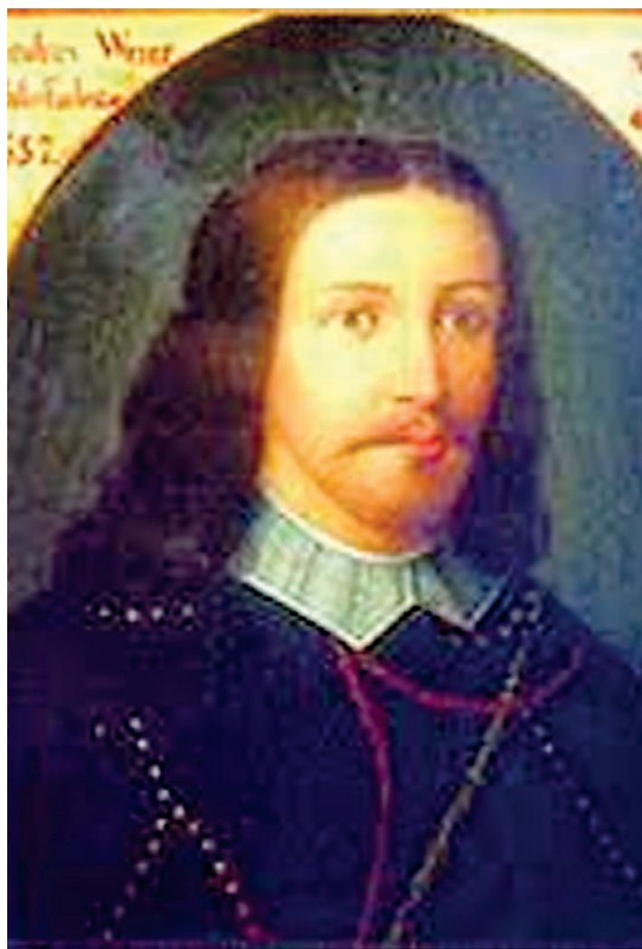
Portret Jakuba Wejhera.

się wojaczkę. Służył między innymi w elitarnej armii Ligi Katolickiej książąt Rzeszy Niemieckiej. Walczył w Hiszpanii, Belgii, Niemczech i na Malcie. Prawdopodobnie z tego okresu pochodzi krzyż maltański umieszczony na tarczy herbowej Wejherowa.