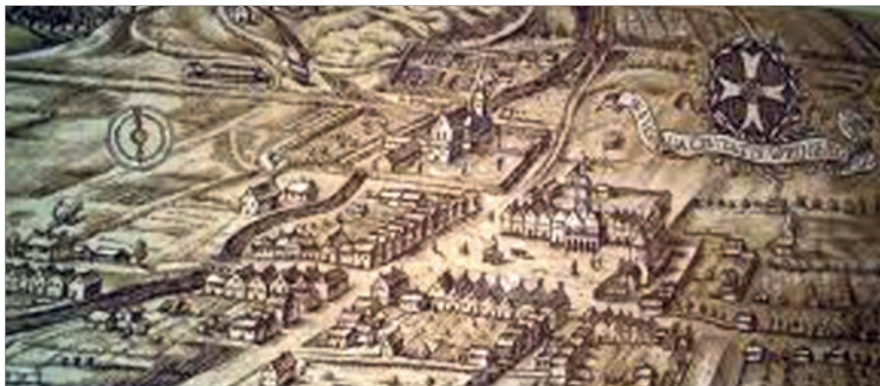
Widok Wejherowa w XVII wieku.

Był jednym z najznajmniejszych mieszkańców Pomorza. Walczył w wielu bitwach, znał władców Europy. Jednak dziełem jego życia było wybudowanie zupełnie nowego miasta. Mowa o Jakubie Wejherze, twórcy Wejherowa.