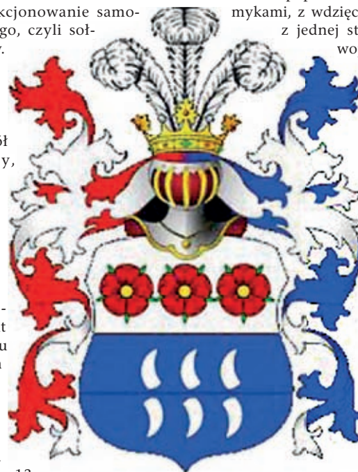
Osobisty herb Jakuba Wejhera.

Herb nowego miasta miał przedstawiać krzyż maltański na niebieskim polu i czerwona róża po środku. Całość miała być otoczona wieńcem z wawrzynu.