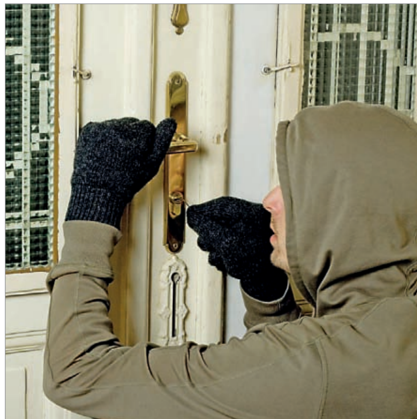
Włamania były jednym z najczęstszych przestępstw w 2011 roku.

Karolina Chalecka k.chalecka@agmedia.com.pl