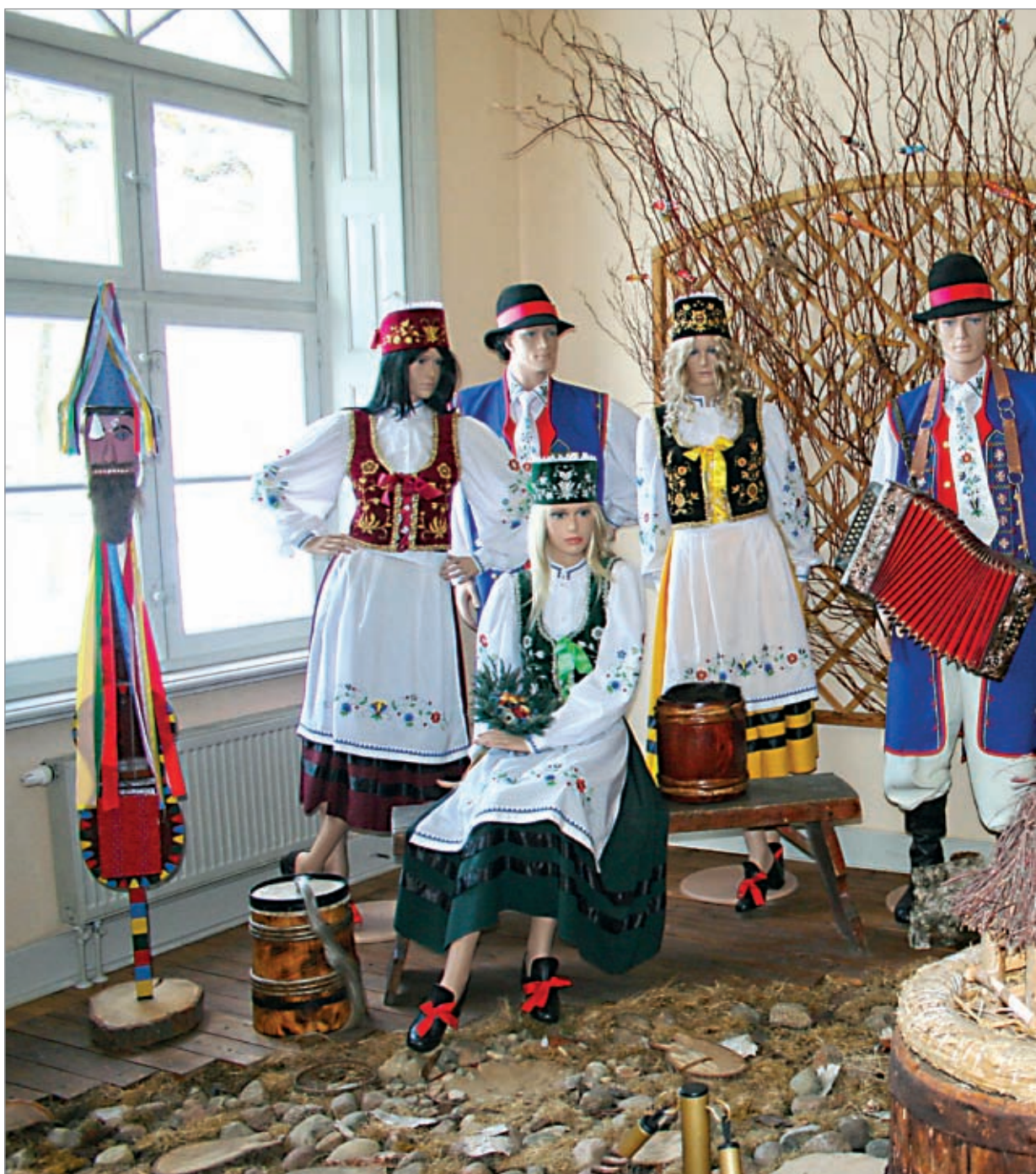
Kapela żywcem z kaszubskiej zagrody.