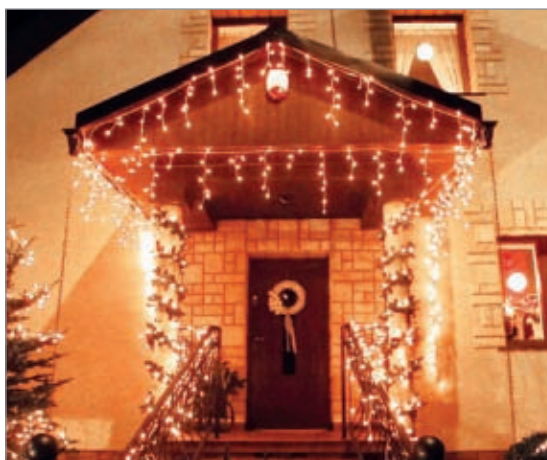
Pierwsze miejsce w kategorii domów jednorodzinnych.