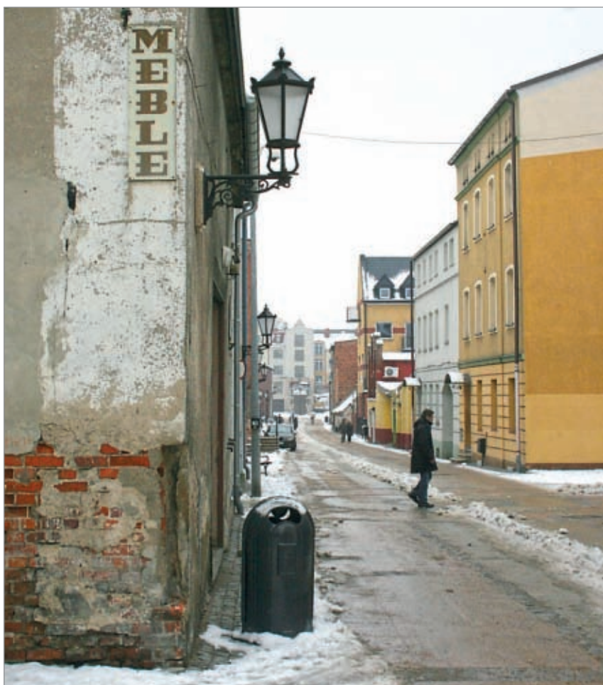
Stylowe lampy na jednym z budynków przy ulicy Wałowej

Rewitalizacja to działania, których celem jest ożywienie i rozwój miasta. Na program składa się w Wejherowie, między innymi, przebudowa ul. Wałowej i terenów przyległych, modernizacja Parku Miejskiego, budowa nowego centrum kultury - „Filarmonii Kaszubskiej” i promenady pieszo-rowerowej wzdłuż rzeki Cedron. Oprócz tego, wykonane będą nowe elewacje budynków. Zmiany dotkną systemów ogrzewania. Na koniec wykonane będą prace porządkowe i rozbiórka szpeczących obiektów. Wejherowska Rewitalizacja Śródmieścia skupia się na trzech aspektach – przestrzenny (budowa nowej nawierzchni, parkingów, ścieżek w parku), gospodarczy (stworzenie atrakcyjnych terenów czy lokalów pod inwestycje) oraz społeczny (plac zabaw, powstanie centrum kultury, działania społeczno – edukacyjne)