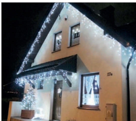
Trzecie miejsce w kategorii domów jednorodzinnych.