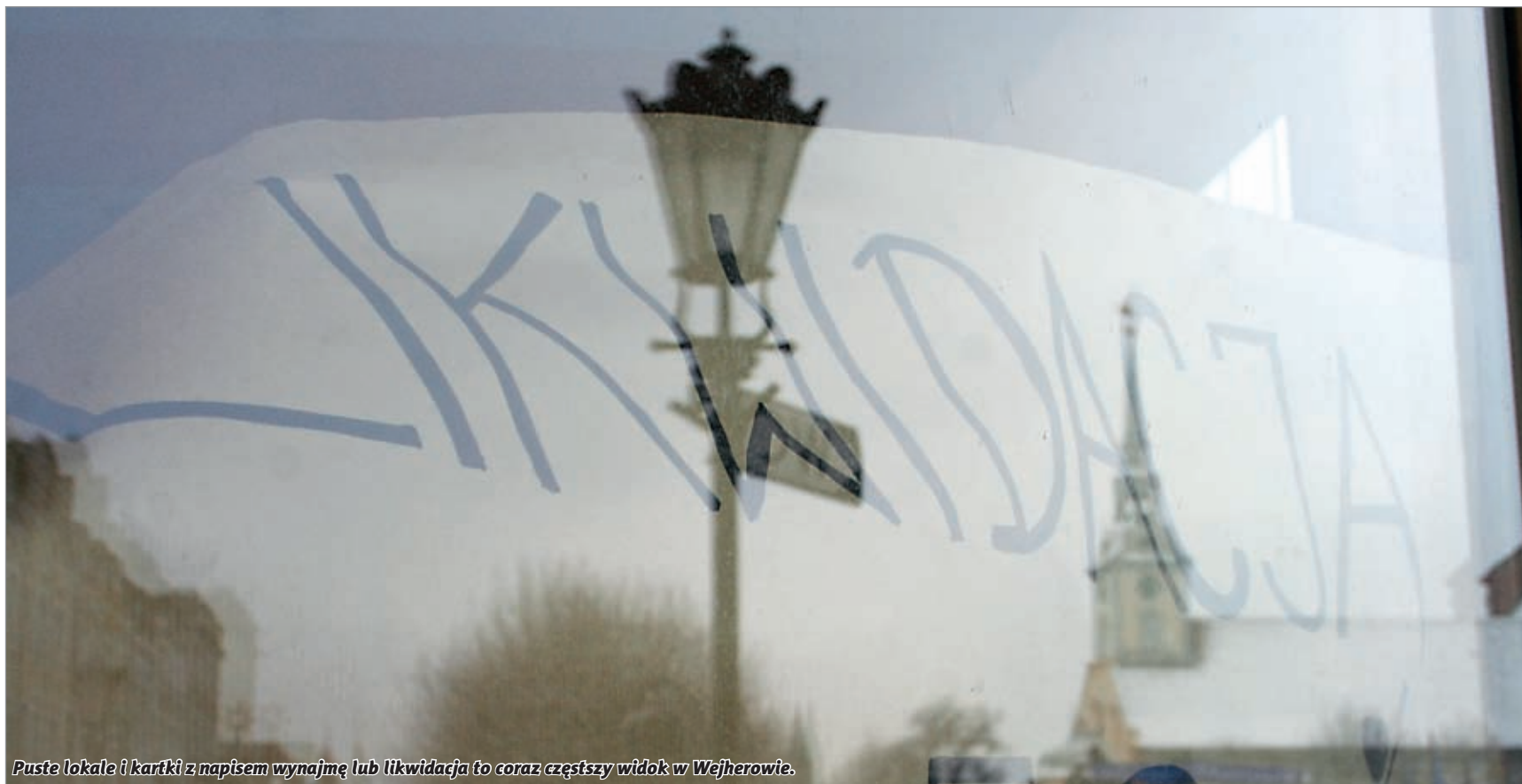
Puste lokale i kartki z napisem wynajmę lub likwidacja to coraz częstszy widok w Wejherowie.