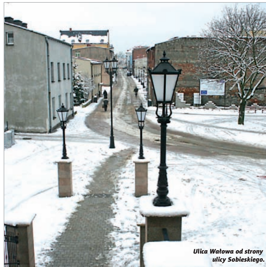
Ulica Wałowa od strony ulicy Sobieskiego.

Mieszkańcy ulicy są, w większości, zadowoleni ze zmian, ale oczekują kolejnych. – W miejscach gdzie zostały wyburzone stare budynki powinny jak najszybciej powstać nowe – dodaje pan