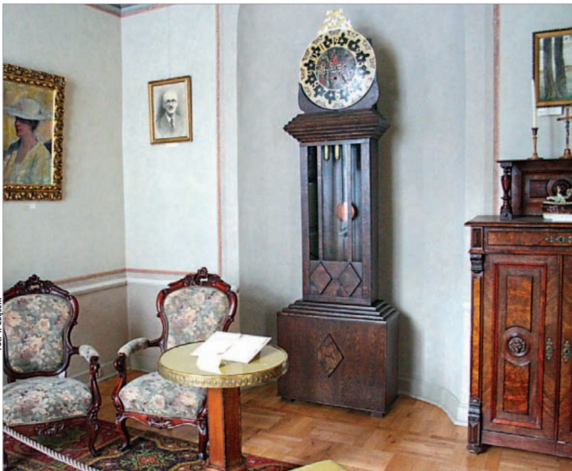
Pokój Aleksandra Majkowskiego.

Muzeum wejherowskie czynne jest codziennie. W sezonie, czyli od pierwszego kwietnia do 30 października zwiedzający mogą przychodzić przez cały tydzień w godzinach od 10 do 18 Natomiast poza sezonem od poniedziałku-piątku w godzinach 9 - 15, a w soboty i niedziele 11 - 17