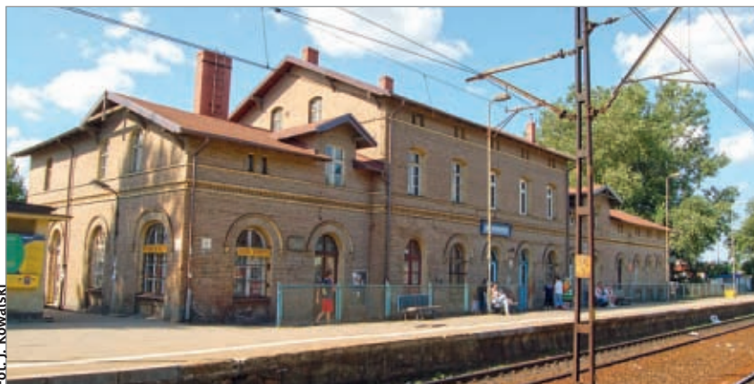
12 grudnia wszedł w życie nowy rozkład jazdy.

Nie ma natomiast większych zmian w kursowaniu przejeżdżających przez Wejherowo pociągów dalekobieżnych. Nowością jest powrót nazw dla składów TLK (Twoich Linii Kolejowych) uruchamianych przez PKP InterCity. Na tory wróciły TLK „Albatros” Szczecin – Gdynia, „Gryf” jadący do Olsztyna, czy „Rybak” do Białegostoku oraz „Pobrzeże” do Krakowa. Zdaniem kolejarzy z PKP IC, nazwy ułatwiają podróżnym identyfikację pociągów. To nie wszystkie „dalekobieżne” nowości. Już od poniedziałku, 19 grudnia, na przejazd pociągami „Pobrzeże” relacji Kołobrzeg – Kraków Główny (z Wejherowa o godz. 9.55) potrzebna będzie miejscówka. PKP IC wprowadza pilota-