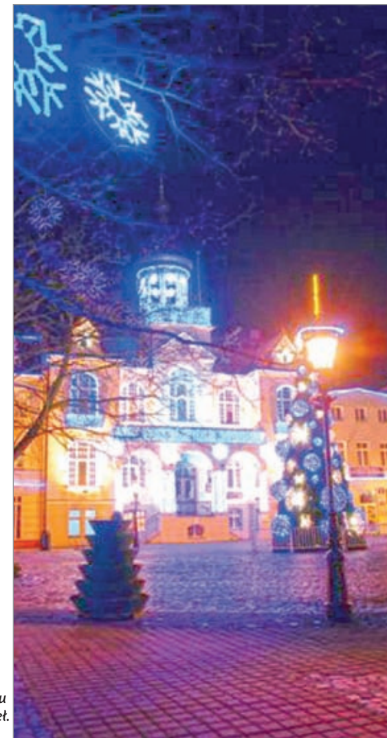
Ratusz w blasku światła.