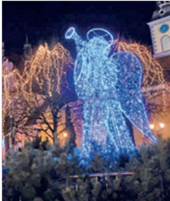
Anioł na fontannie.

Wejherowski Urząd Miasta na świąteczną iluminację wyda w tym roku 50 tysięcy złotych. Na placu Wejhera pojawiła się świąteczna choinka, a na wielu ulicach światełka.