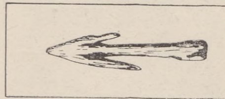
Grot strzaly — Budzistowo — Kołobrzeg