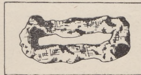
Krzesiwko — Koszalin — Góra Chełmska