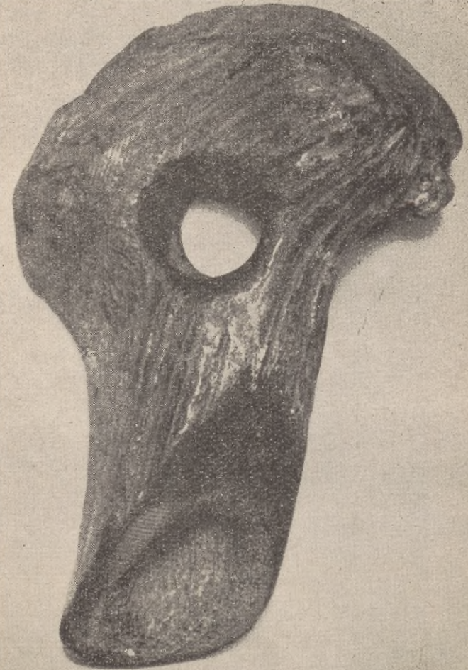
Rogowa motyka z młodszej epoki kamiennej (2500—1700 l. p. n. e.) Pomorze Zachodnie

Przedmioty te wykonane są z kamienia, rogu, kości brzozy lub z żelaza. Na podstawie tych znalezisk archeolodzy „odczytują” najdawniejsze dzieje naszych mieszkańców, ich życie, zwyczaje, obyczaje, wierzenia i stosunki społeczno-gospodarcze.