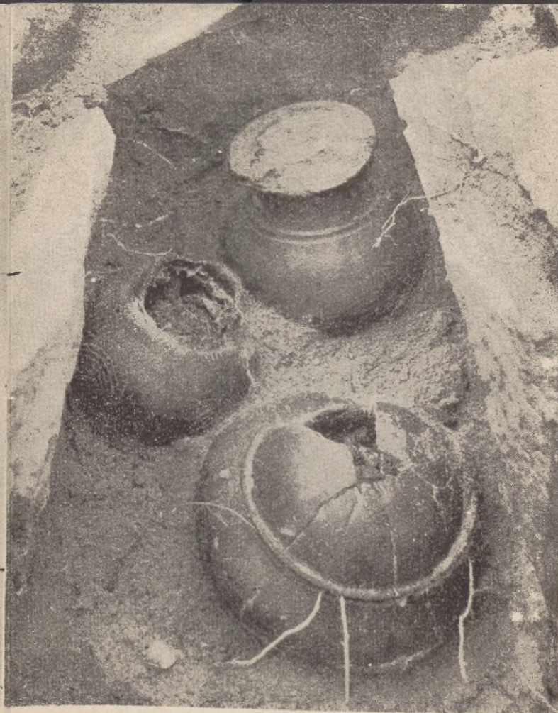
Rodzinny grób skrzynkowy kultury pomorskiej (700 l. p. n. e.) z Łysomiec, pow. Słupsk

Każdy z nas ma sposobność bezpośredniego zetknięcia się z zabytkami archeologicznymi. Spotykamy je nie tylko w czasie badań archeologicznych. Odkrycia zabytków dokonuje się najczęściej w trakcie prowadzenia różnego rodzaju prac ziemnych. Nierzadko odkryje je łopata robotnika w czasie kopania fundamentów, wybierania żwiru (Cewlino, pow. Koszalin), budowy dróg.