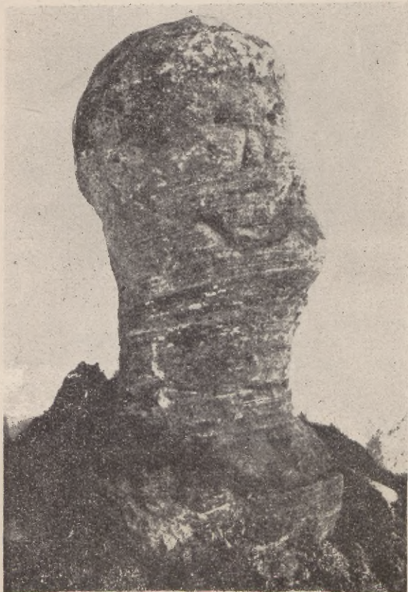
Słowiański bożek „Belbuk”, wytowiony z jeziora Łubicko, pow. Szczecinek