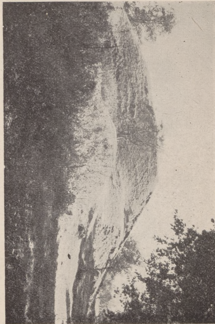
Stowickie grodzisko wczesno-średniowieczne z Radacza, pow. Szczecinek