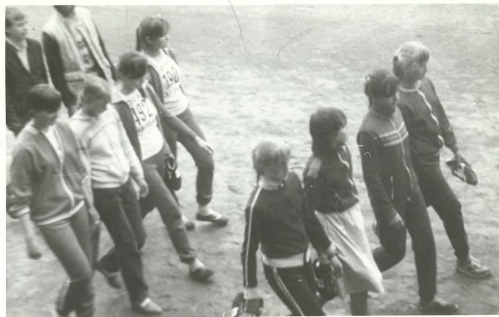
Reprezentacja dziewcząt - I miejsce

Z okazji 40 rocznicy wyzwolenia Pruszcza odbędą się w tym miesiącu następujące imprezy: 21 bm. - biegi uliczne, godz. 14 młodzież szkolna, godz. 15.30 pracownicy za kładów pracy, zbiórka w klubie M-6. 22 bm. - turniej tenisa stołowego, godz. 16, SP nr 3. 23 bm. - finał turnieju szachowego młodzieży szkolnej, godz. 10, SP nr 2. 23 bm. - turniej siatkarski, godzina 9, SP nr 2. 26 bm. - biśmykowy turniej szachowy, ogólnodostępny, godz. 17, klub M-6. 31 bm. - turniej brydżowy, godz. 10, MDK przy ul. Chopina 34. Zgłoszenia w dniach imprez na godzinę przed ich rozpoczęciem.