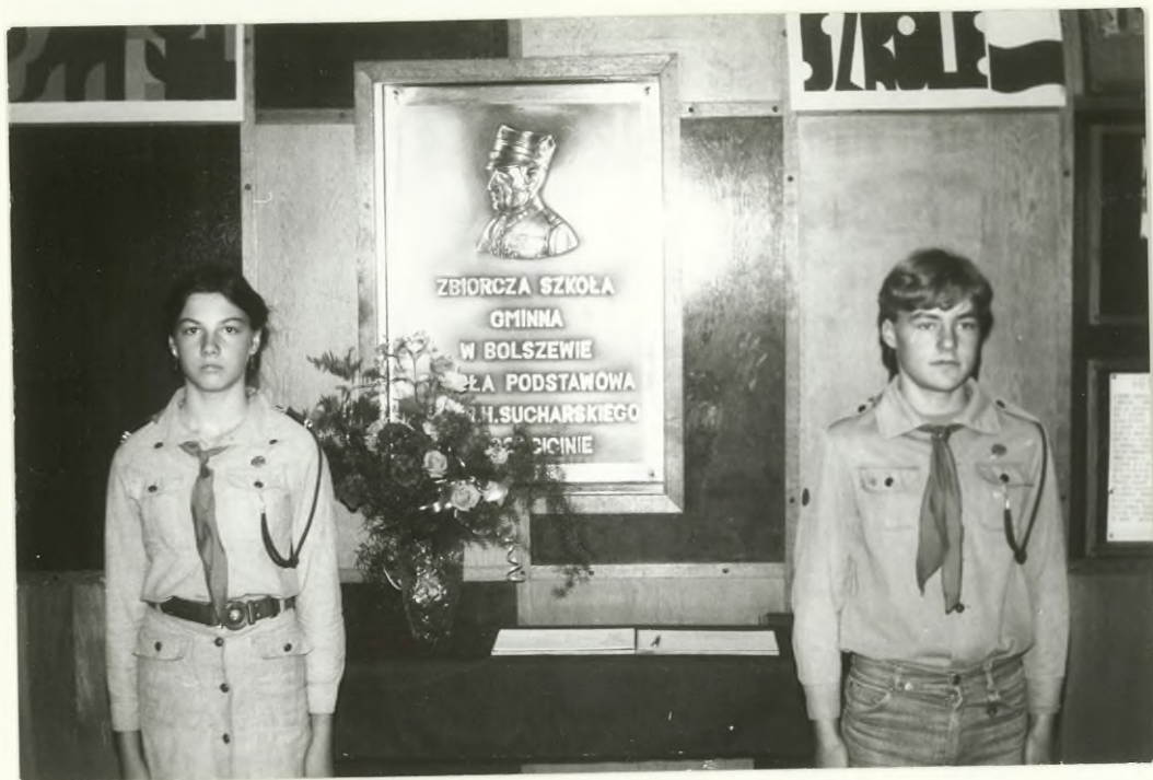
WARTA HONOROWA PRZY TABLICY PAMIĄTKOWEJ PATRONA NASZEJ SZKOŁY