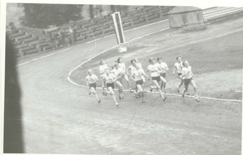
Dziewczęta w czasie biegu