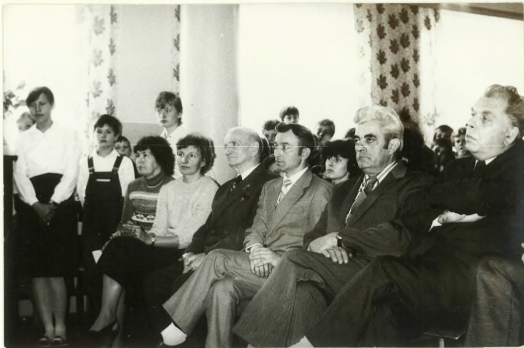
ZAPROSZENI GOŚCIE PODCZAS UROCZYSTEJ AKADEMII