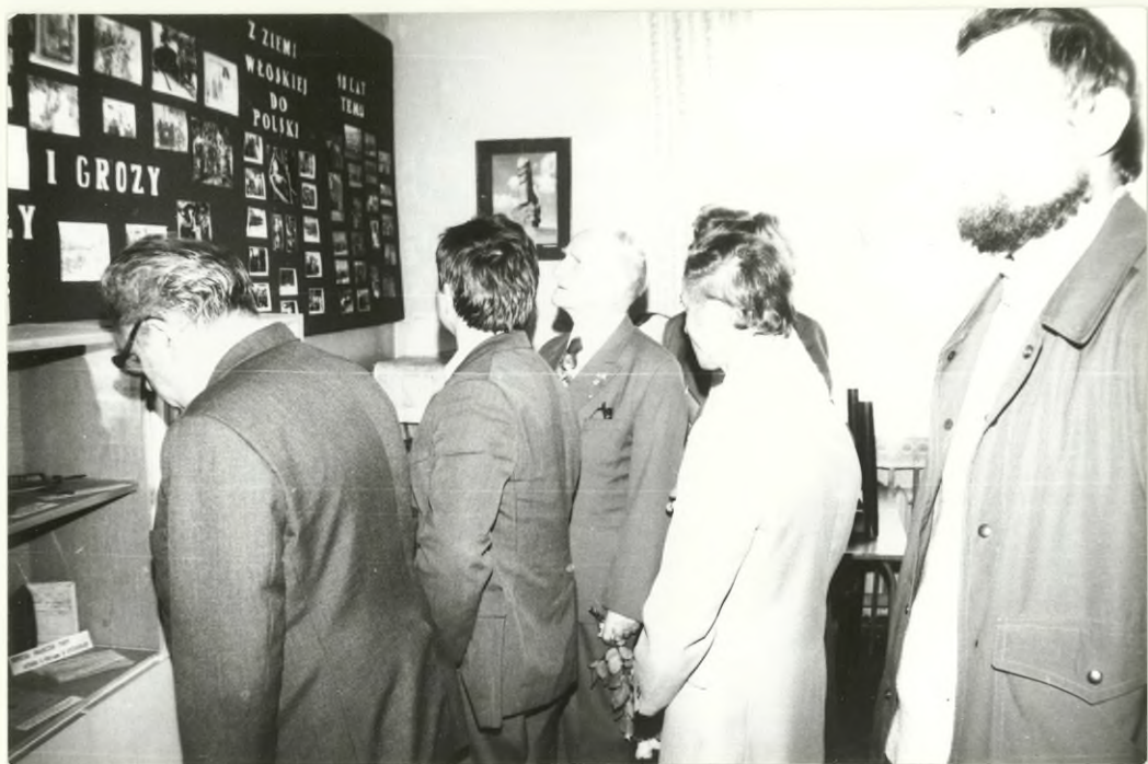
ZAPROSZENI GOŚCIE ZWIEDZAJĄ GABINET HISTORYCZNY