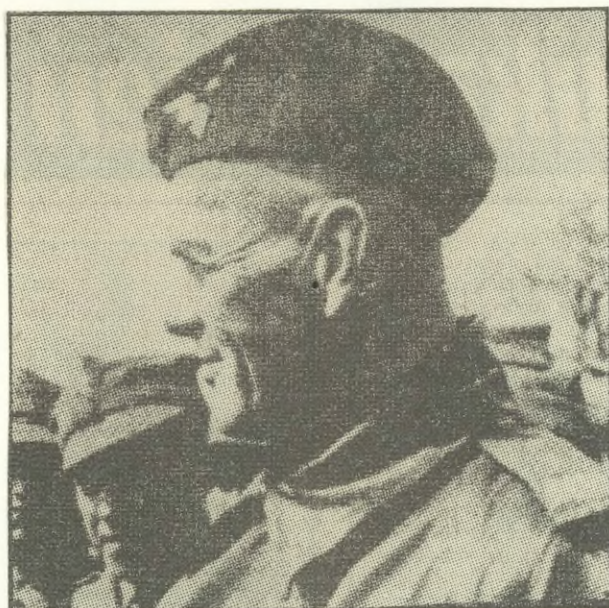
Gen. Zygmunt Berling.