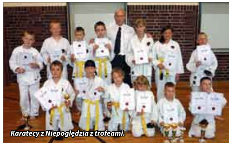
Karatecy z Niepogłędzia z trofeami.