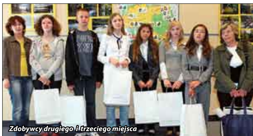
Zdobywcy drugiego i trzeciego miejsca