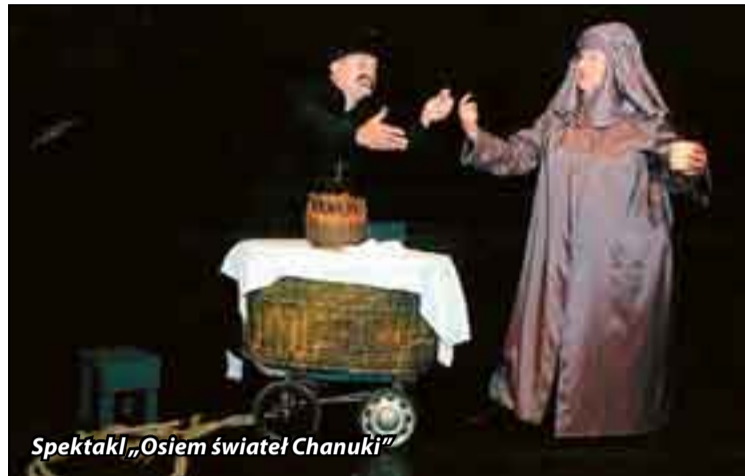
Spektakl „Osiem światel Chanuki”