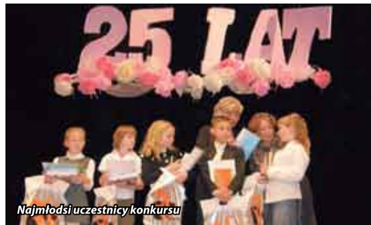
Najmłodsi uczestnicy konkursu

Po raz 25. odbył się w Słupsku Ogólnopolski Konkurs Literacki dla Dzieci i Młodzieży gimnazjalnej. Jego mecenasem jest poetka – Wanda Chotomska . W swoim prywatnym rankingu wydarzeń kulturalnych związanych z dziećmi uznała ten konkurs za najciekawszy i najbardziej godny poparcia. Jego finaliści przyjeżdżają corocznie na spotkanie w słupskim teatrze, które stało się jedynym w Polsce, autentycznym świętem literatury dziecięcej.