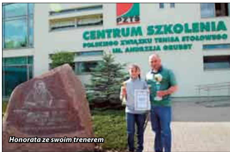
Honorata ze swoim trenerem