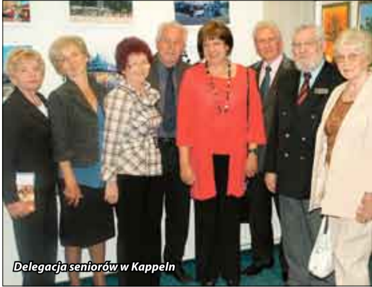
Delegacja seniorów w Kappeln

Na zaproszenie Rady Starszych Kappeln, w niemieckim mieście partnerskim Ustki przebywała sześciuosobowa delegacja słuchaczy Usteckiego Uniwersytetu Trzeciego Wieku. Z usteckimi seniorami spotkał się burmistrz Kappeln, który wspominał swoje pobyty w Ustce. W maju przyszłego roku planowany jest przyjazd do Ustki 30-osobowego chóru seniorów z Kappeln śpiewających muzykę folkową.