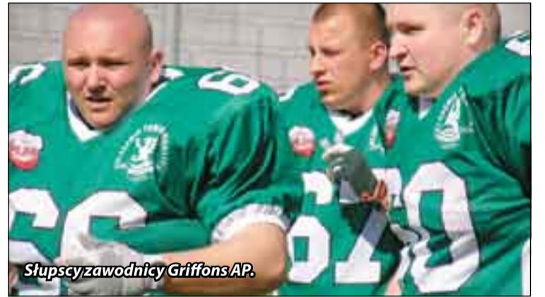
Słupscy zawodnicy Griffons AP.

Drużyna futbolu amerykańskiego Griffons Akademia Pomorska Słupsk dotychczas w rozgrywkach II ligi rozegrała dwa spotkania. I obydwa przegrała.