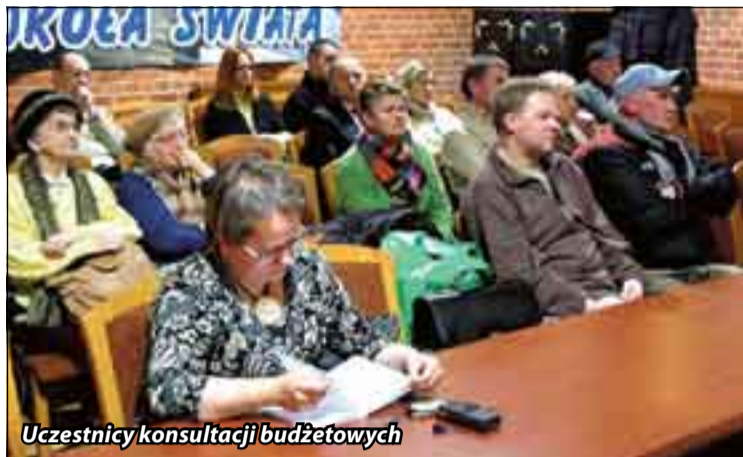
Uczestnicy konsultacji budżetowych

Ustecki ratusz przygotował projekt przyszłorocznego budżetu miasta. Zaplanował dochody w wysokości 49 milionów złotych, a wydatki – 48,7 mln złotych. Projekt został już skonsultowany z mieszkańcami. Co wynika z tych spotkań? To, że potrzeby miasta wielokrotnie przewyższają jego finansowe możliwości. Nic więc dziwnego, że wielu ustczan nie kryło rozczarowania.