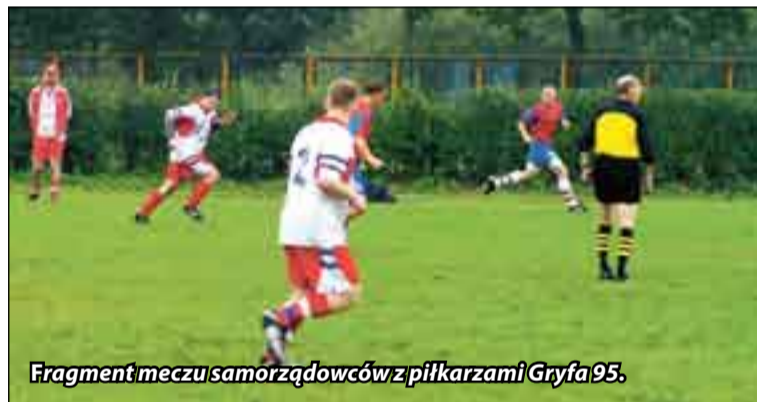
Fragment meczu samorządowców z piłkarzami Gryfa 95.

Na boisku w Parku Kultury i Wypoczynku zmierzyły się drużyny piłki nożnej samorządowców Urzędu Miejskiego w Słupsku i piłkarskiej drużyny Gryfa 95. Mimo ogromnych ambicji rajcy przegrali różnicą kilku bramek.