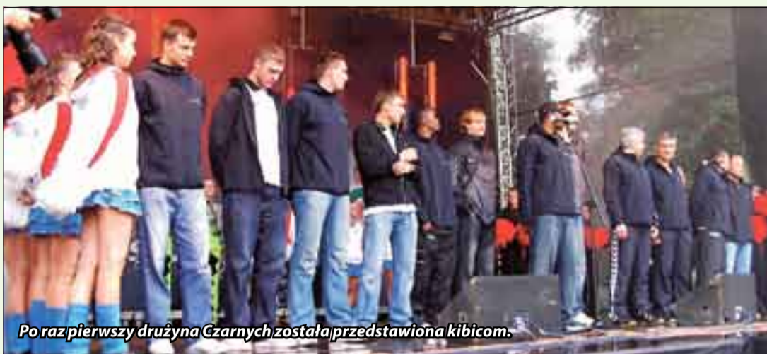
Po raz pierwszy drużyna Czarnych została przedstawiona kibicom.