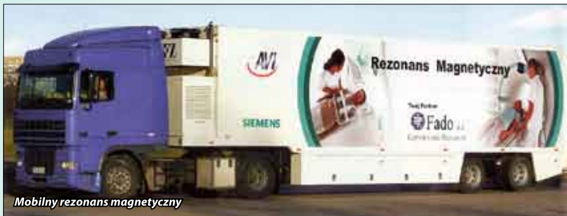
Mobilny rezonans magnetyczny

To jest bardzo dobra wiadomość dla pacjentów z rejonu Słupska. Od wczoraj, tj. od 21 sierpnia, mogą na miejscu wykonać badanie rezonansem magnetycznym. Specjalny kilkunastometrowy mobilny zestaw na kołach, z ważącym 6 ton rezonansem, jeszcze dzisiaj znajduje się na terenie szpitala przy ul. Kopernika. Pacjent otrzyma wyniki badania w ciągu doby.