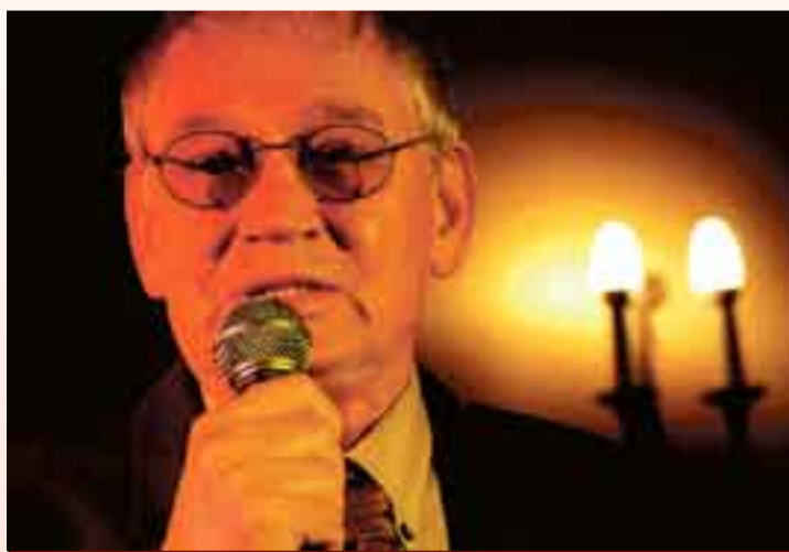
Leszek Długosz podczas koncertu „Wieczór z bardem”

Bałtycka Galeria Sztuki w Ustce zaprasza 29 sierpnia o godz. 18 na koncert Leszka Długosza i wystawę rysunków Janusza Kapusty . Koncertowi towarzyszy promocja książki L. Długosza pt. „Podróże”. Wystawa będzie czynna do 22.09.2008. Wstęp wolny.