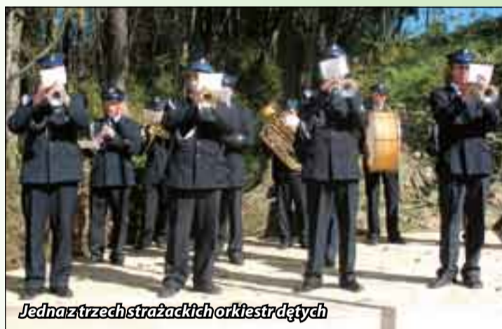
Jedna z trzech strażackich orkiestr dętych