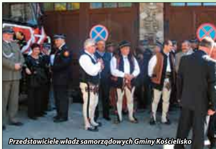
Przedstawiciele władz samorządowych Gminy Kościelisko