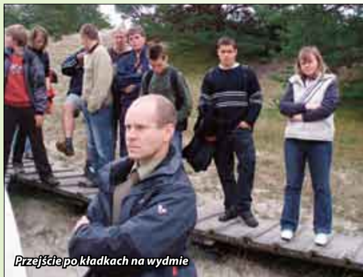
Przejsście po kładkach na wydmie

ludzie. Okazało się, że poprzedniego dnia goście byli w Gdańsku i nie mieli przewodnika, który potrafiłby zainteresować zdyscyplinowaną niemiecką grupę. – Wykład naszego przewodnika roił się od dat i nazwisk, które niewiele nam mówiły i znaczyły – mówiła jedna z opiekunek.