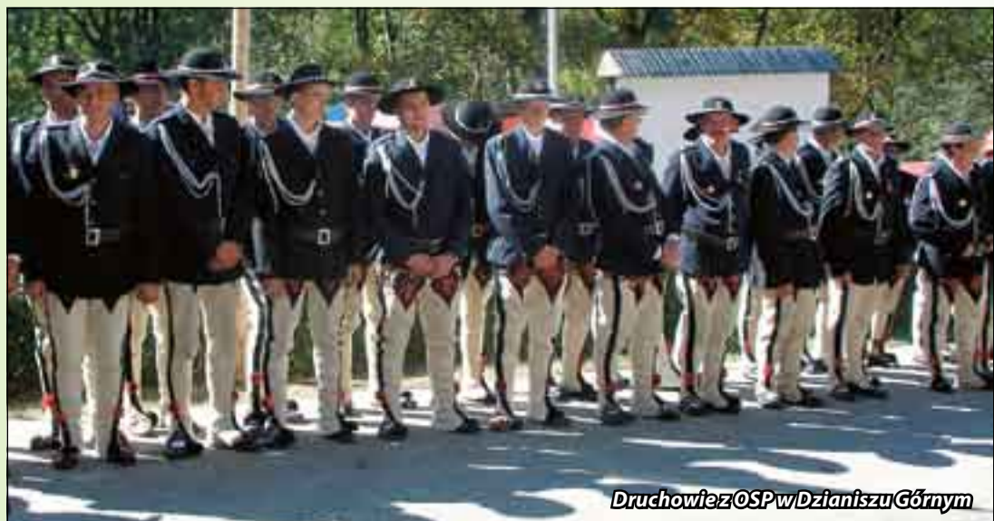
Druchowie z OSP w Dzianiszu Górnym

I miejsce za produkt „łytek cielący z psiochą”, czyli gicz cielącą z kluskami ziemniaczanymi. Góralska kwaśnica, którą nam zaserwowała, smakowała wybornie!