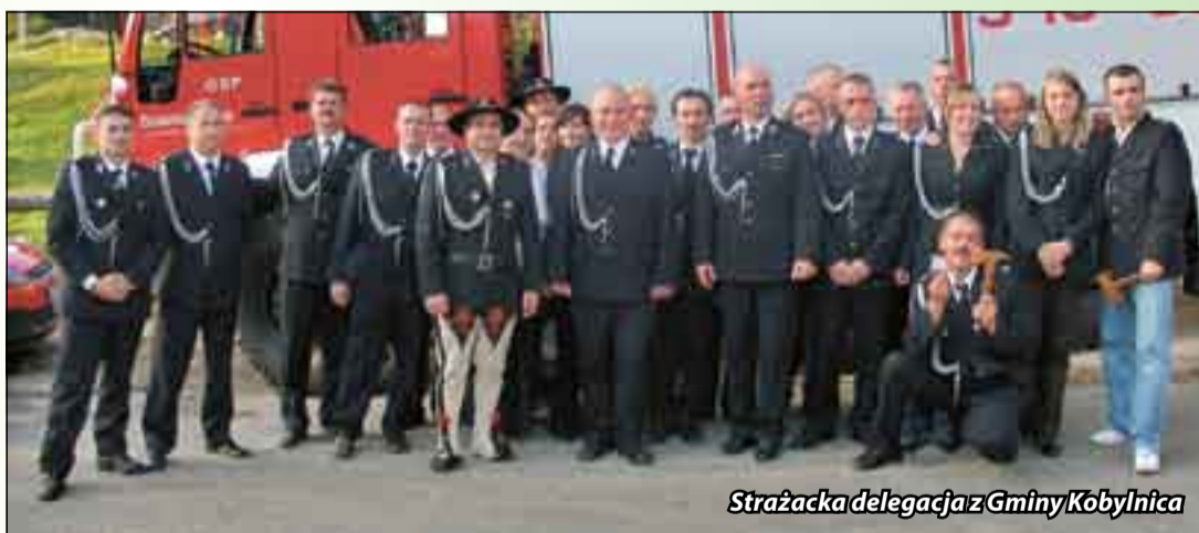
Strażacka delegacja z Gminy Kobylnica