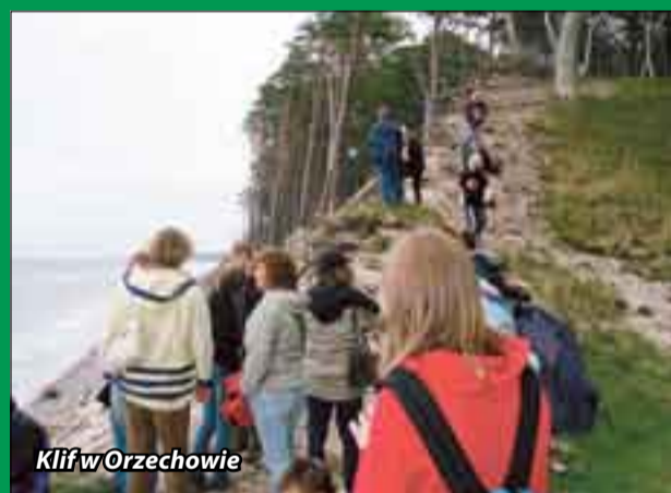
Klif w Orzechowie