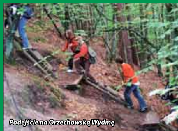
Podejście na Orzechowską Wydmę