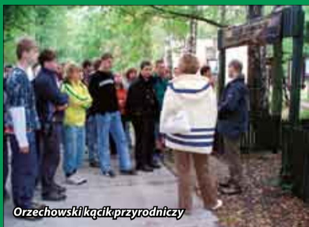
Orzechowski kącik przyrodniczy

Młodzi ludzie wyjechali pełni wrażeń. Mamy nadzieję, że będziemy ich gościć w przyszłym roku podczas wspólnego przedsięwzięcia. Podziękowania należą się Nadleśnictwu Ustka za bezinteresowne udostępnienie swoich obiektów. Oraz tłumacze za pomoc w znalezieniu wspólnego języka.