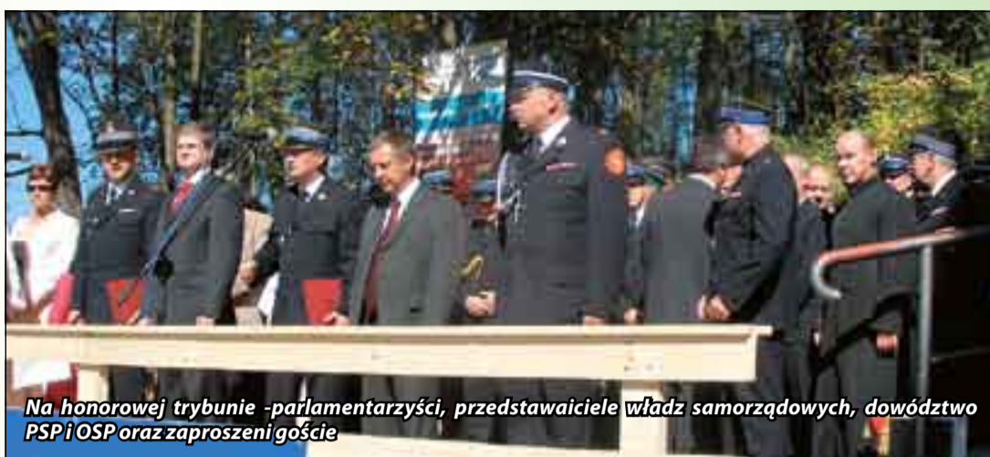
Na honorowej trybunie -parlamentarzyści, przedstawiciele władz samorządowych, dowództwo PSP i OSP oraz zaproszeni goście

Impreza była fest – mówią mieszkańcy Dzianisza i zaproszeni na obchody półwiecza goście. 23 września strażacy-ochotnicy z Dzianisza Górnego w gminie Kościelisko świętowali pięćdziesięciolecie swojej jednostki.