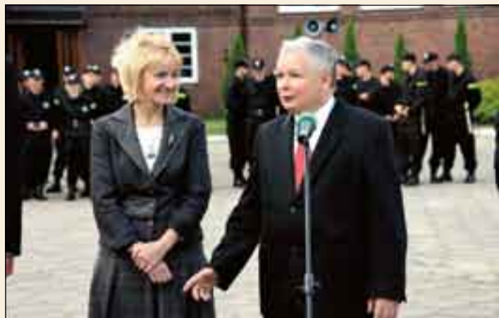
Premierowi towarzyszyła m.in. posłanka na Sejm RP Jolanta Szczypińska. Podczas spotkania wyraźnie dało się zauważyć, że Jarosław Kaczyński i Jolanta Szczypińska darzą się wielką sympatią. Pani poseł bardzo przeżywała wystąpienie premiera...

Podczas konferencji prasowej, kończącej wizytę w Szkole Policji, premier Jarosław Kaczyński odniósł się także do informacji o planach