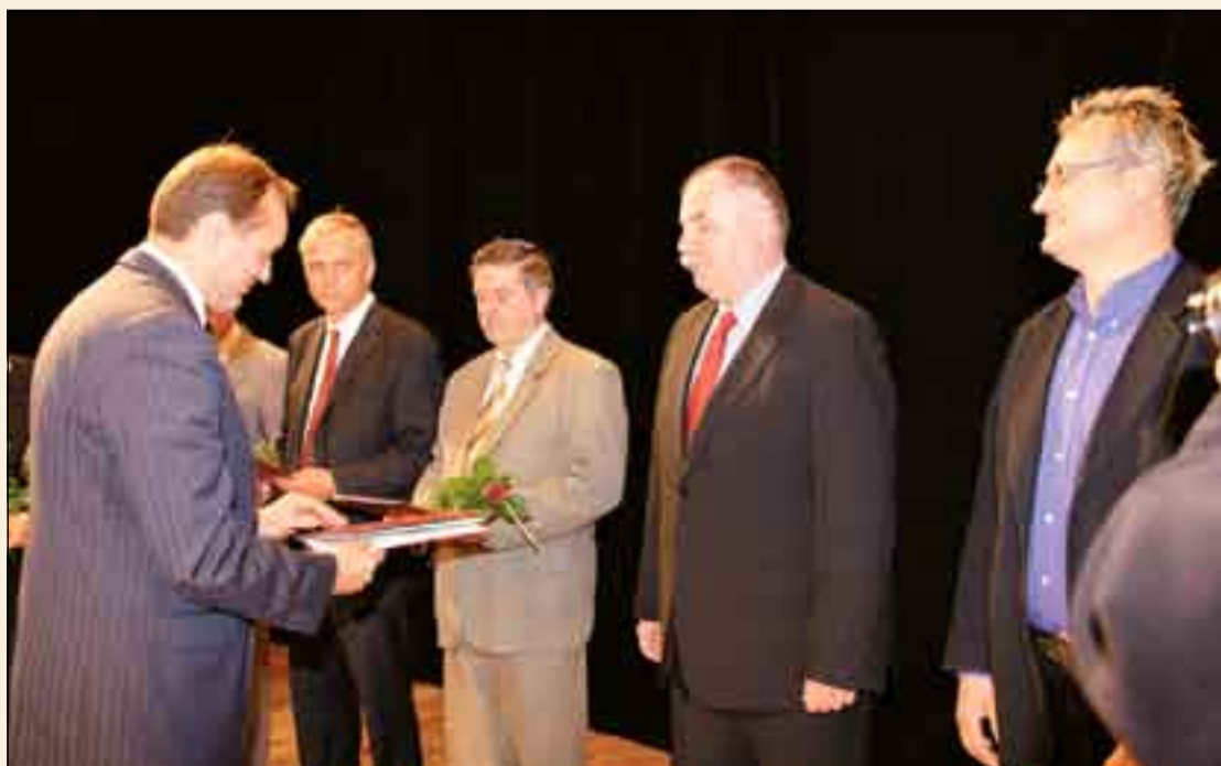
Uroczystość była wspaniałą okazją do wręczenia 5 nowych zezwoleń będących upoważnieniem do podjęcia działalności gospodarczej na terenie Słupskiej Specjalnej Strefy Ekonomicznej dla firm: „Paliwa Ekologiczne” Sp. z o.o., „Tritec Polska” Sp. z o.o., „LEANN” Sp. z o.o., Przetwórstwo Tworzyw Sztucznych „PLAST-BOX” S.A. oraz „NORD EXPRESS” Sp. z o.o.