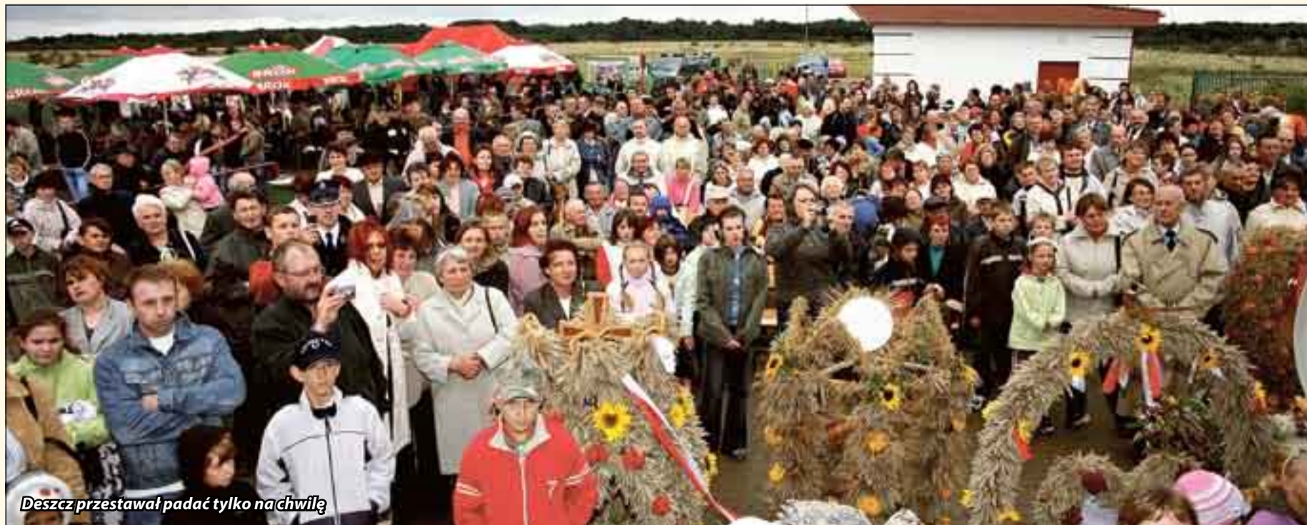
Deszcz przestawał padać tylko nachwilę