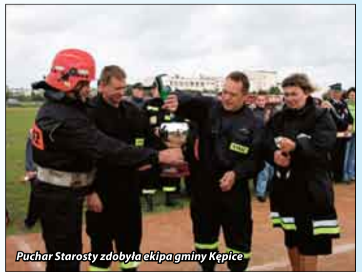
Puchar Starosty zdobyła ekipa gminy Kępcice