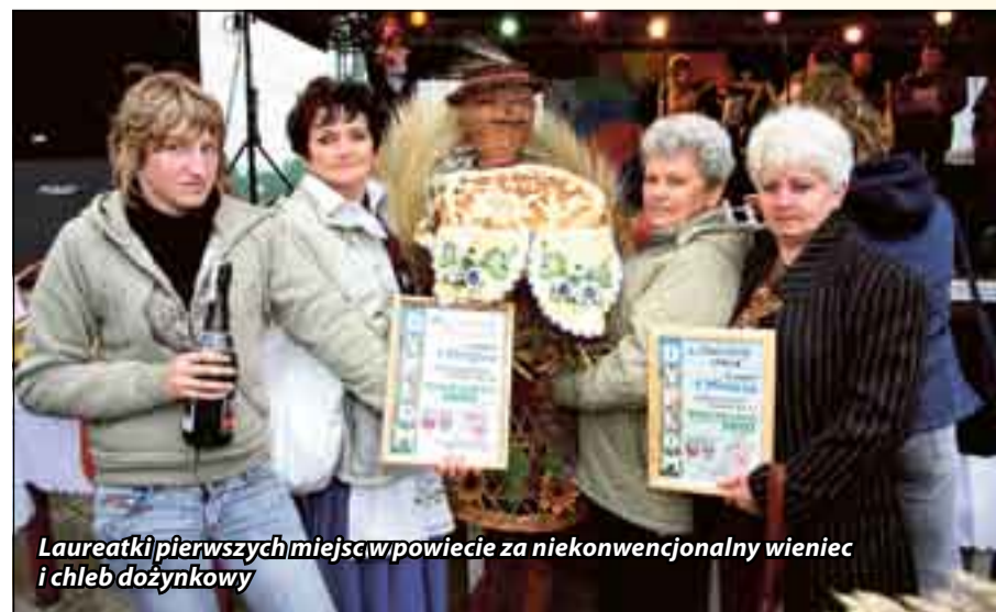
Laureatki pierwszych miejsc w powiecie za niekonwencjonalny wieńec i chleb dożynkowy