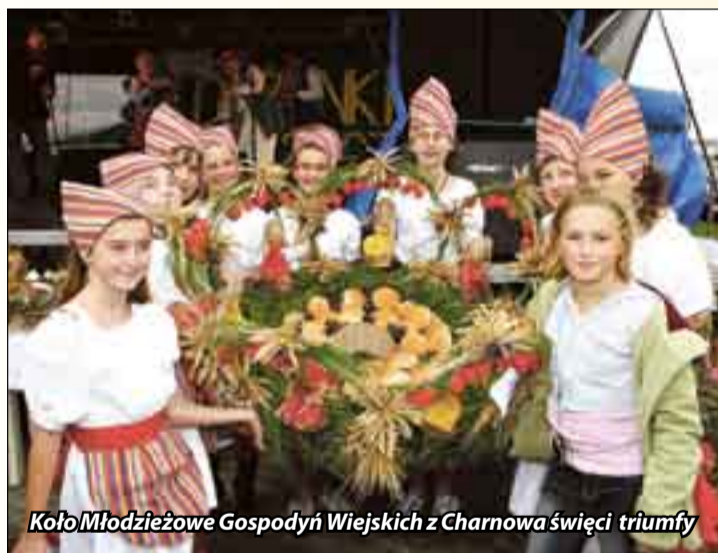
Koło Młodzieżowe Gospodyń Wiejskich z Charnowa święci triumfy