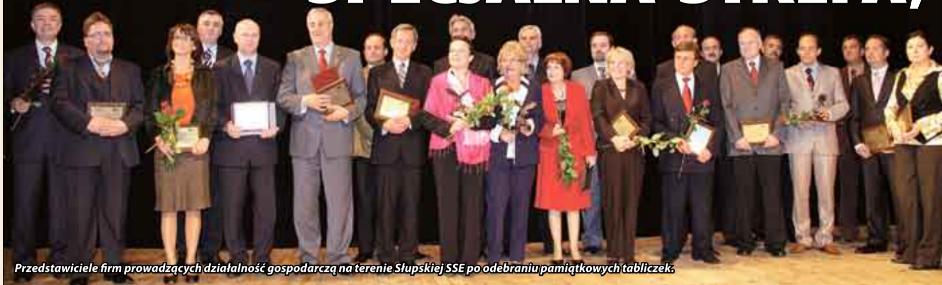
Przedstawiciele firm prowadzących działalność gospodarczą na terenie Słupskiej SSE po odebraniu pamiątkowych tabliczek