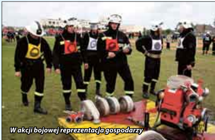
W akcji bojowej reprezentacja gospodarzy