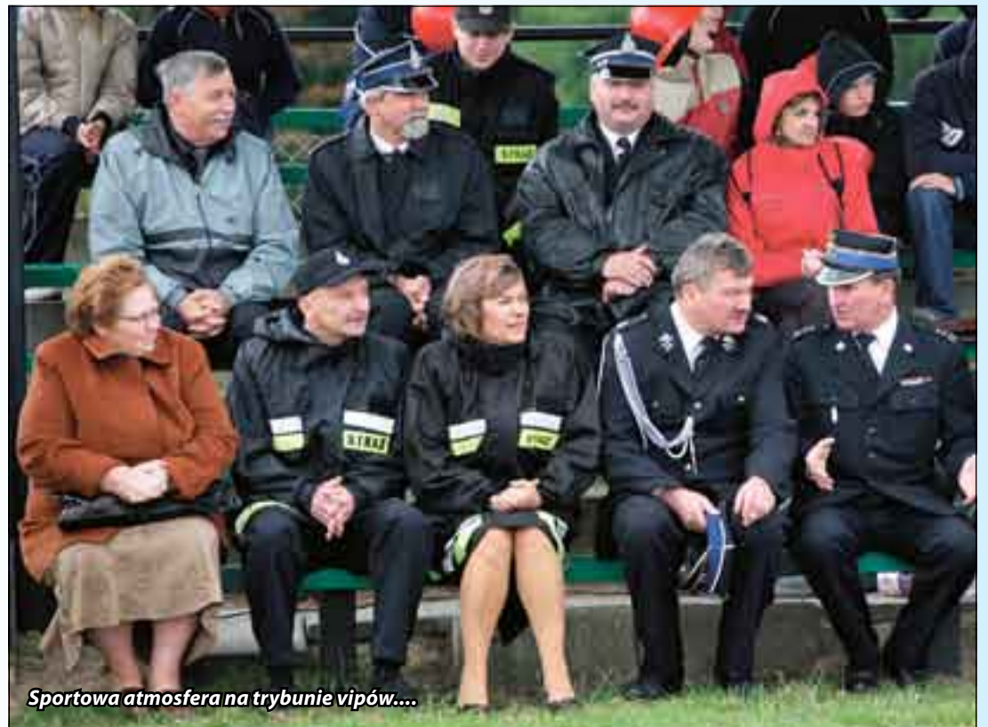
Sportowa atmosfera na trybunie vipów....