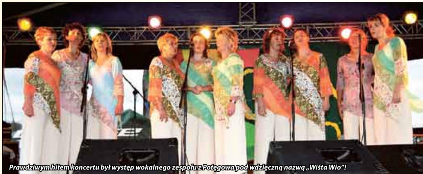
Prawdziwym hitem koncertu był występ wokalnego zespołu z Potęgowa pod wdzięczną nazwą „Wiśta Wio”!