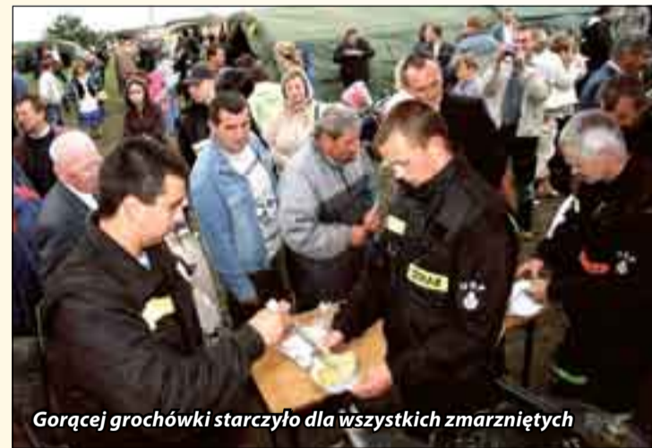
Gorącej grochówki starczyło dla wszystkich zmarzniętych

Do konkursu chlebów zostało zgłoszonych 17 bochenków. W powiatowym konkursie