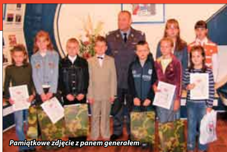
Pamiątkowe zdjęcie z panem generałem