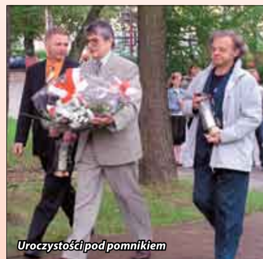
Uroczystości pod pomnikiem