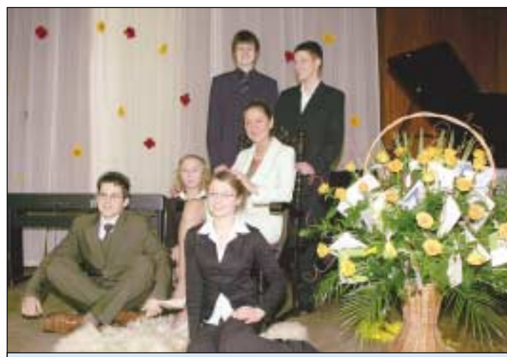
Pani dyrektor z bukietem 30 róż – każda za rok pracy

szkolnego. Drzwi do gabinetu Pani Dyrektorki są zawsze otwarte dla każdego ucznia, a Pani Dyrektorka jest doskonałym słuchaczem i obserwatorem. Nigdy nie zostawia uczniów bez pomocy gdy proszą o radę, co sprawia, że uczniowie nie boją się Jej, a wręcz przeciwnie, zawsze witają Panią Dyrektorkę z uśmiechem i szacunkiem. Pani Dyrektorka jest również