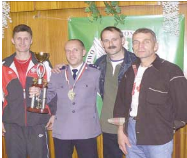
Nagrodzeni reprezentanci Słupskiej Szkoły Policji