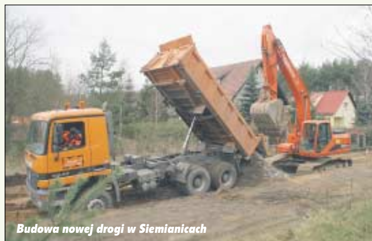
Budowa nowej drogi w Siemianicach

W Siemianicach natomiast zaczęła się adaptacja – z nadbu-