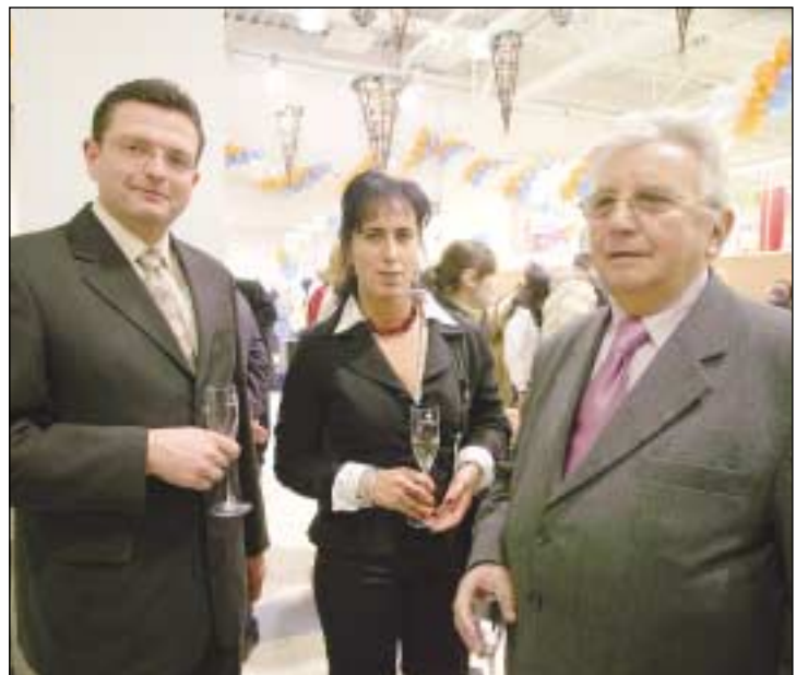
Szefowie firmy Krężel - budownicy E.LECLERC

We Francji spółka ma 391 hipermarketów, 131 supermarketów i 39 magazynów. Firma obecna jest także w innych krajach europejskich. Ma 20 marketów (supermarketów i hipermarketów) w Polsce, 10 we Włoszech, 7 w Portugalii, 6 w Hiszpanii i jeden w Słowenii.