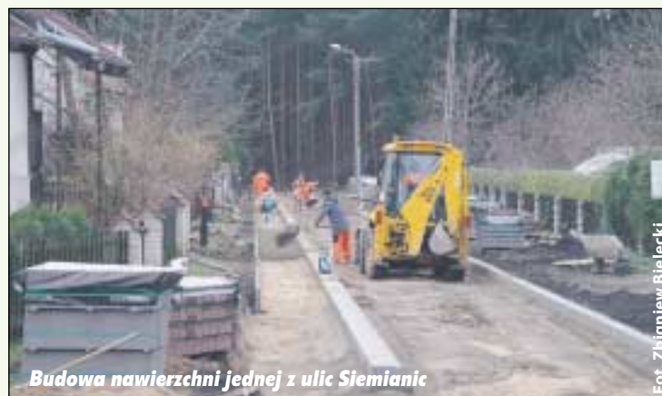
Budowa nawierzchni jednej z ulic Siemianic