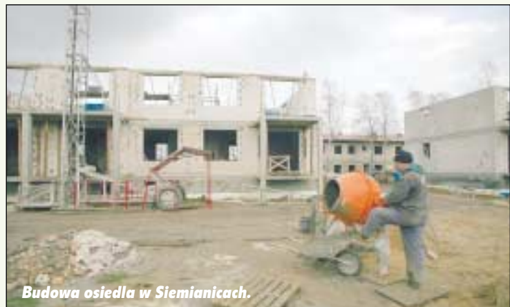
Budowa osiedla w Siemianicach.

Gmina Słupsk na realizację zadań inwestycyjnych w 2006 roku przeznaczyła kwotę 16 mln zł. Większość prac została już zakończona i rozliczona. W chwili obecnej kontynuowane są inwestycje,