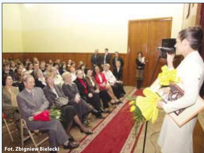
Fot. Zbigniew Bielecki