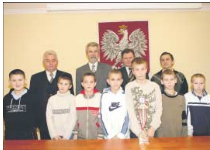
Mistrzowie Polski z pucharem