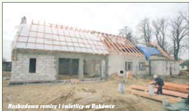
Rozbudowa remizy i świetlicy w Bukówce