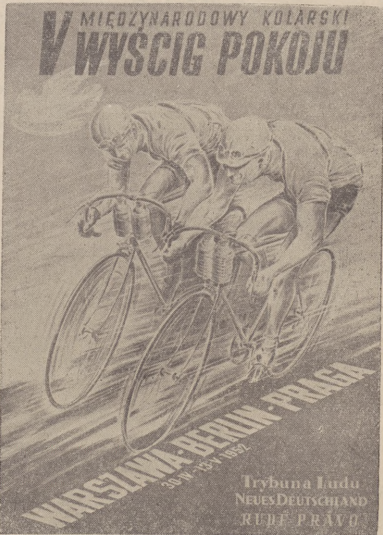
Plakat wścigu Warszawa — Berlin — Praga wykonany przez artystów - grafików: P. Świątkowskiego i K. Maliszewskiego.

Gazeta do użytku wewnętrznego w jednostkach Marynarki Wojennej. Poza teren jednostki nie wносить.