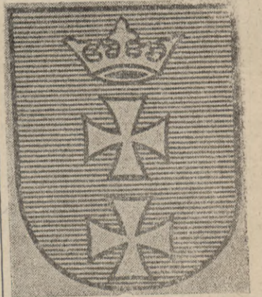
Od wieku XV

Jeden z najwspanialszych herbów nad kominkiem w sali ratuszowej, zniszczony niestety w 1945 roku, ukazał dalsze urozmaicenia i ozdoby tarczy miejskiej.