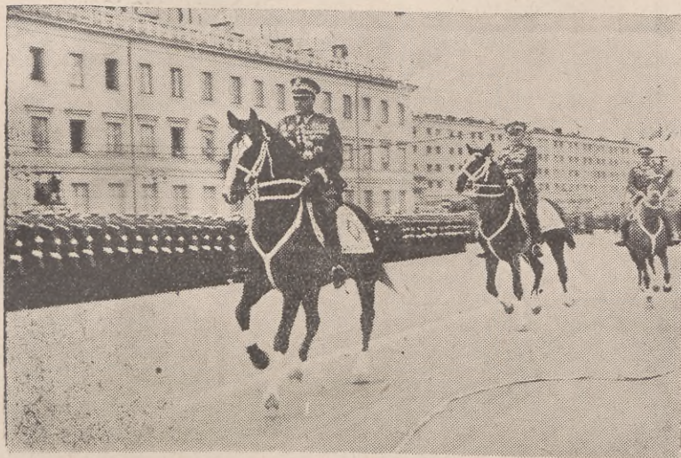
Na zdjęciu: przed rozpoczęciem defilady Marszałek Polski Konstanty Rokossowski w towarzystwie Wiceministra Obr. Nar. gen. Popławskiego dokonał przeglądu zgrupowanych oddziałów

Z przemówienia wicepremiera Mołotowa na Akademii w Warszawie