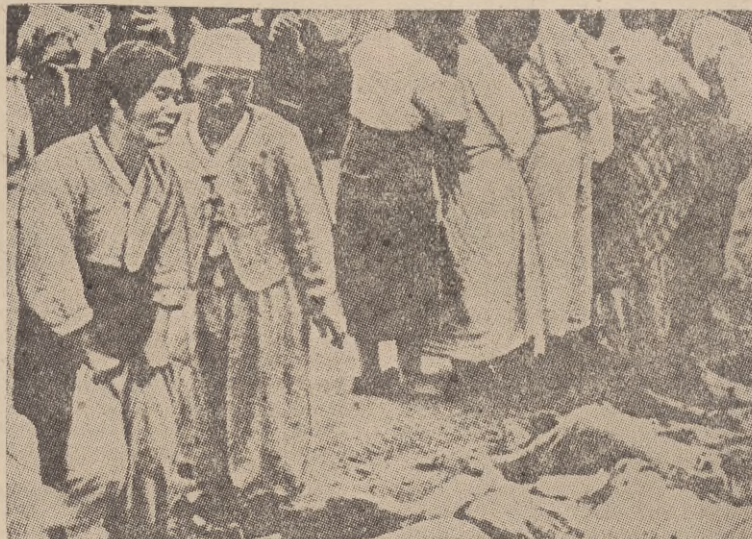
I jeszcze jeden obraz — bardzo wiele mówiący. Marynarzu przyjrzyj się uważnie tym zdjęciom. Nigdy nie zapomnij imperia-listom ich zwyrodnialstwa i zbrodni.