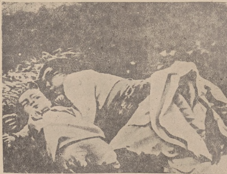
Zamordowana matka i dziecko — oto obiekt „strategiczny” barbarzyńców z Wall Street. Ten obraz głęboko utkwii w pamięci naszym matkom. Nie zapomni cała postępową ludzkość tych zbrodni. Naród koreański jeszcze bardziej wzmacnia swoją aktywność w walce — widząc te faszystowskie okrucieństwa.