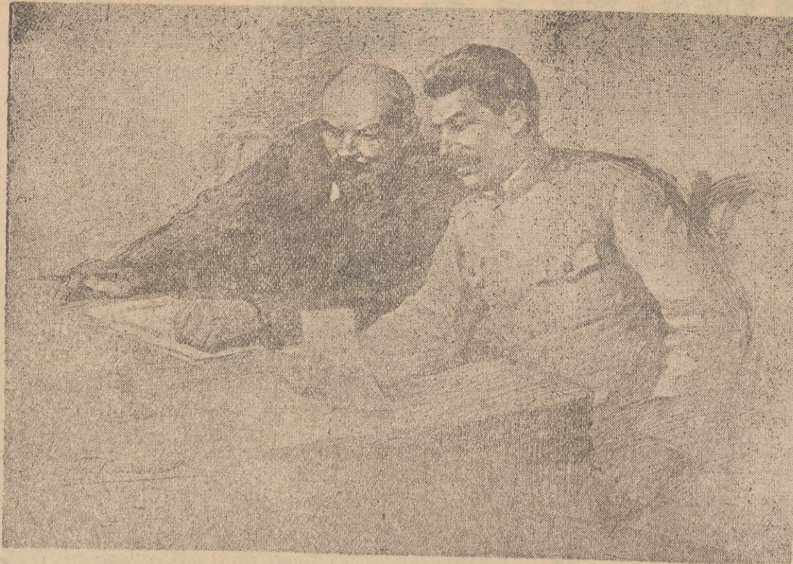
Lenin w czasie narady ze swoim najbliższym współpracownikiem J. Stalinem.

Szczególną wagę przywiązywał Lenin do sojuszu robotniczo-chłopskiego. Do tego czasu partie socjaldemokratyczne nie zajmowały się sprawami chłopskimi, nie widziały w pracującym chłopstwie sojusznika klasy robotniczej. Lenin od samego początku swej działalności zajmuje się sprawą wyzwolenia chłopów. Lenin oparł się na naukach Marksa i Engelsa o stosunku klasy robotniczej do chłopstwa i w swojej pracy: „Kto to są przyjaciele ludu i jak oni walczą przeciw