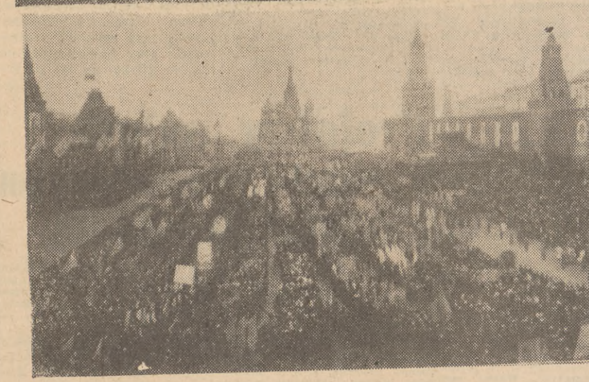
W dniu 7 bm., w rocznicę Wielkiej Socjalistycznej Rewolucji Październikowej, odbyła się na Placu Czerwonym defilada jednostek garnizonu moskiewskiego. Na zdjęciach: 1) Defiluje broń rakietowa. 2) Manifestacja ludności.