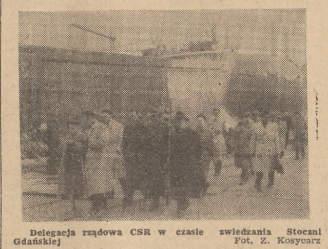
Delegacja rządowa CSR w czasie zwiedzania Stoczni Gdańskiej.

zawsze”, którym też goście udali się na przejażdżkę po morzu. (c)