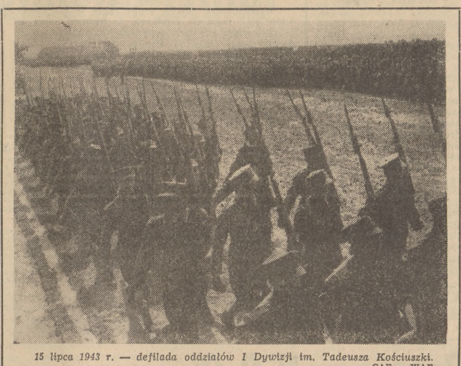
15 lipca 1943 r. — defilada oddziałów I Dywizji im. Tadeusza Kościuszki.

Za dotrzymanie tego terminu PLO deklaruje się wypłacić portowcom do po-