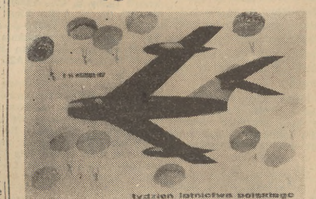
Plakat na „Tydzień Lotnictwa Polskiego”. Autor — Jacek Grabiański