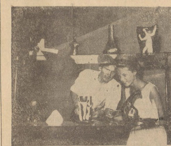
Z wystawy ceramiki kadynskiej w Dworze Artusa w Gdańsku

Już w chwilę po otwarciu, które odbyło się tym razem bez nieodczynnych zwykłe w takich wypadkach przemo- wień i uroczystych gestów, sala wystawowa zapelniała się licznymi zwiedzającymi, którzy zdążyli się już do- wiedzieć z prasy, radia i kro- niki filmowej o „cudach” wyrabianych w Kadynach —