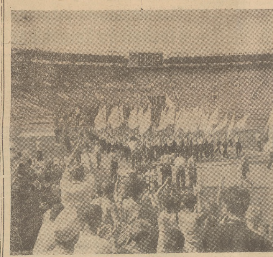
Na zdjęciu: Fragment uroczystości otwarcia Festiwalu na stadionie na Łuznikach.