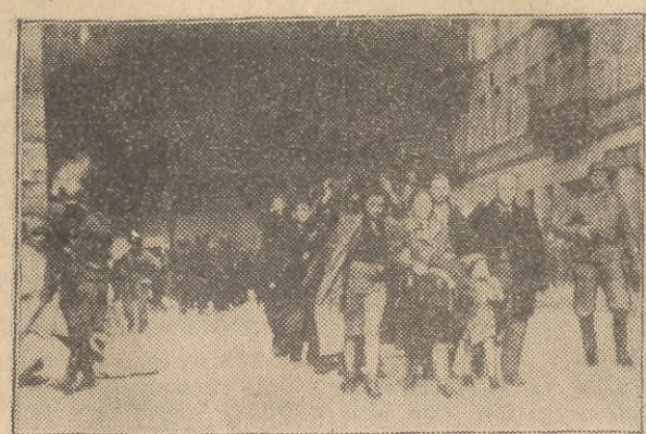
Zdjęcie dokumentalne z okresu likwidacji powstania przez hordy hitlerowskie.