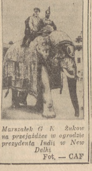
Marszałek G. K. Żukowa na przejażdżce w ogrodzie prezydenta Indii w New Delhi.