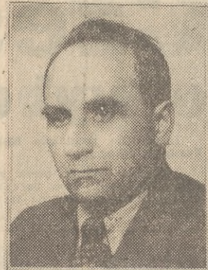
Wczoraj donosiliśmy o spotkaniu czołowego kandydata gdańskiego, członka Biura Politycznego KC PZPR, dr STEFANA JĘDRYCHOWSKIEGO z gdańskimi stoczniovcami w dn. 15 bm. Dziś zamieszczamy fragmenty jego przemówienia.