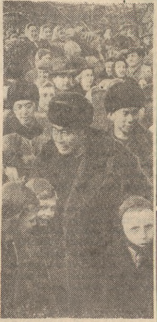
Premier Czou En-lai wśród mieszkańców Łodzi.

Premier Czou En-lai udał się do Budapesztu