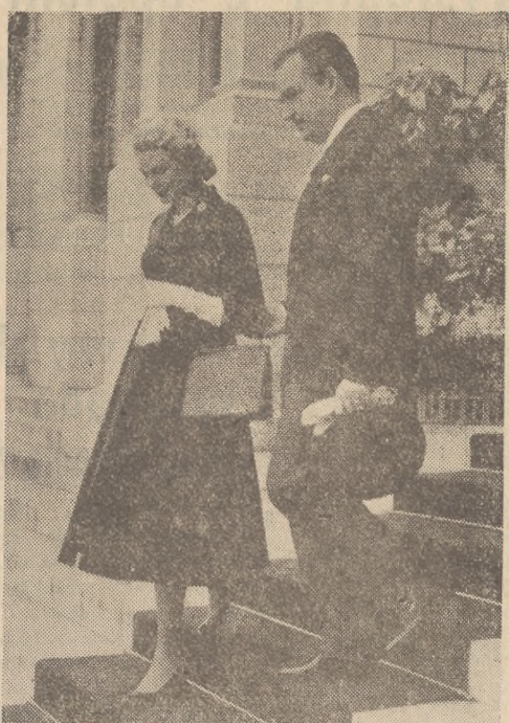
Księżę Rainier i jego żona — Grace w czasie wspólnego spaceru — pierwszego od dnia urodzin małego następcy tronu.