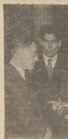
15.IV. br. w godzinach wieczornych przewodniczący Rady Państwa Aleksander Zawadzki wyjął w sali kolumnowej Rady Państwa przyjęcie na cześć delegatów na IV Krajowy Kongres Związków Zawodowych. Na zdjęciu: podczas przyjęcia. Aleksander Zawadzki w rozmowie z przedstawicielami związków zawodowych Chin i Chile przybyłymi na Kongres.

Krótko po godz. 18 przybył na salę obrad witań serdecznie przez uczestników Kongresu — K. Woroszyłow. Odpowiadał na powitanie dolegatów polskich związkowców.