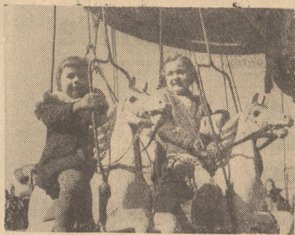
...na Placu Zebrań Ludowych najmłodszy i najstarsi gdańszczanie odwiedzają b. „Wesołe miasteczko”, które od pewnego czasu nosi nazwę „Lunapark”.