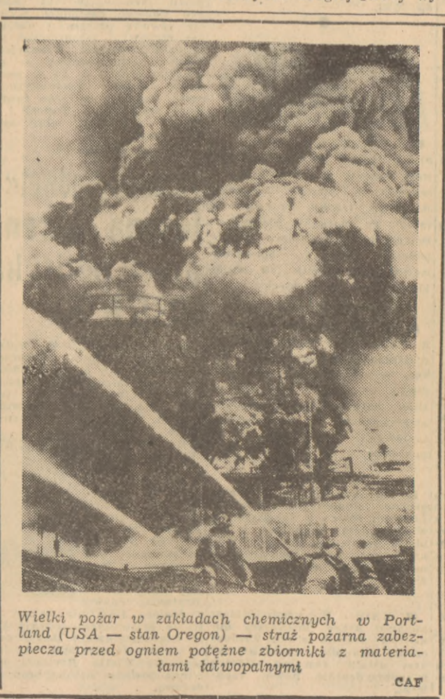
Wielki pożar w zakładach chemicznych w Portland (USA — stan Oregon) — straż pożarna zabezpiecza przed ogniem potężne zbiorniki z materiałami łatwopalnymi

JAK DONOSZĄ Z BUENOS AIRES, według danych krajowego urzędu statystycznego w dniu 12 lutego br. Argentyna liczyła 20.057.700 mieszkańców.