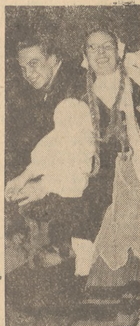
Okazuje się, że Technikum Wychowania Fizycznego w Oliwie posiada bardzo dobry zespół taneczny. Na akademii 1-majowej zespół gorąco był oklaskiwany za wykonanie poloneza, kujawiaka i tańców kaszubskich.

Na kursie pt.: „Sztuka na codzień” obecny cykl odczytów poświęcony jest strojom. Po wykładach na temat ubiorów w średniowieczu i o stroju hiszpańskim słuchacze w ciągu trzech następujących wykładów będą mieli możliwość poznać strój francuski w XVII i XVIII wieku, polskie stroje szlacheckie i mieszczniańskie oraz zmiany zachodzące w modzie XIX wieku.