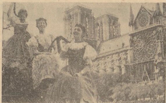
Na zdjęciu: Członkowie zespołu na tle katedry Notre Dame.