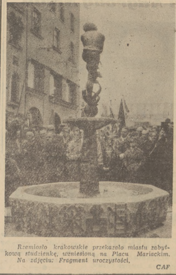
Rzemiosło krakowskie przekazało miastu zabytkową studienkę, wzniesioną na Placu Mariackim. Na zdjęciu: Fragment uroczystości.

Na całość słownika trzeba będzie nieco poczekać (11 lat!), ale chyba każdy rozumie, że słownika tej miary nie wytrząsa się z rękawa. Wymaga on olbrzymiego wysiłku dużego zespołu ludzi. Kto chce dobrze mówić, dobrze pisać, właściwie roz-