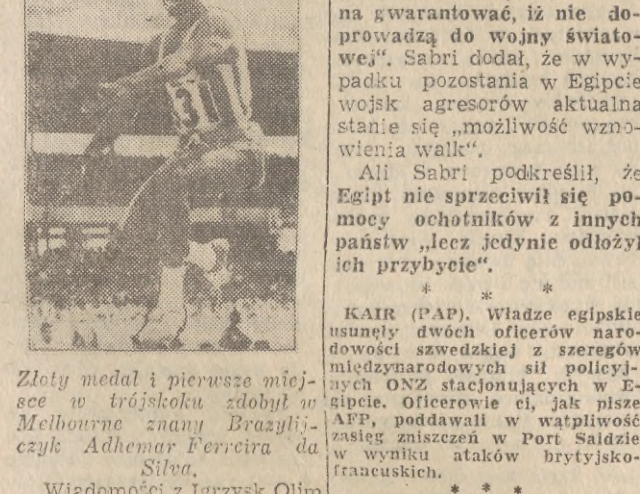
Złoty medal i pierwsze miejsce w trójce zdobył w Melbourne znany Brazylijczyk Adhemar Ferreira da Silva.