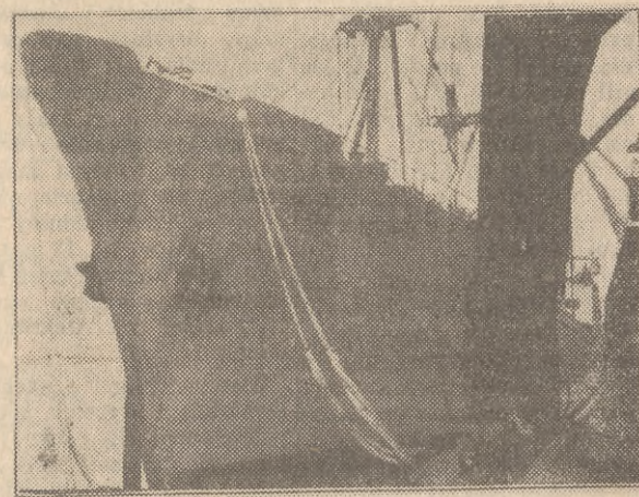
W porcie gdyńskim na kilka godzin przed wypłynięciem w pierwszy rejs do Chin Ludowych.