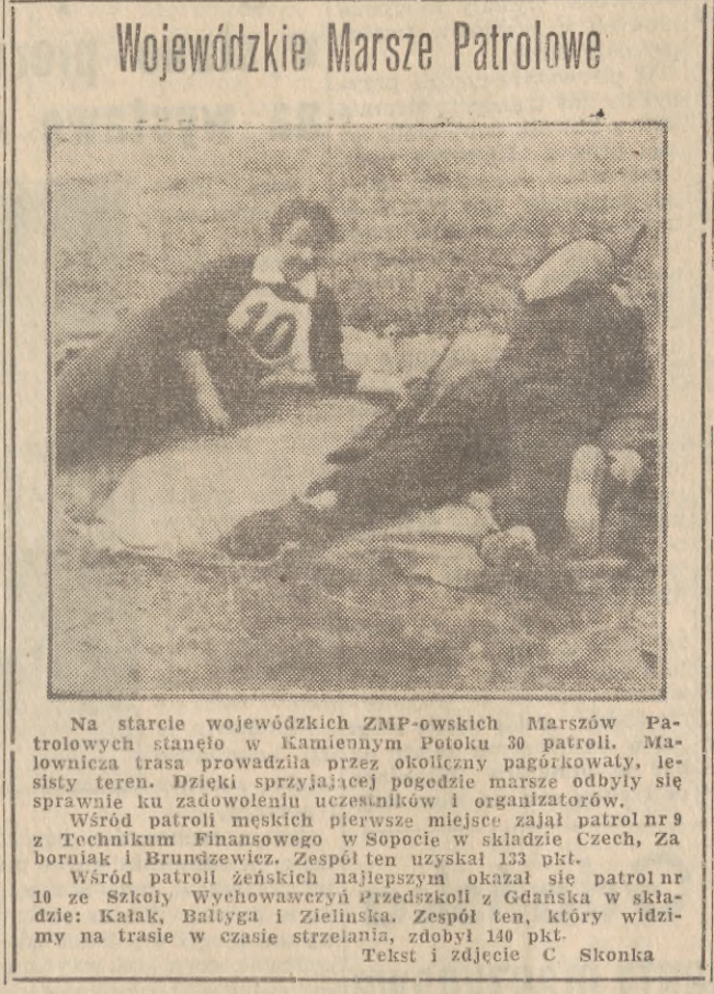
Wojewódzkie Marsze Patrolowe