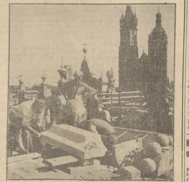
Na zdjęciu: zakładanie nowych cokołów pod maszynami.

W poszczególnych punktach sprzedaży mogą, oczywiście, wynikać jeszcze okresowe przerwy w zaopatrzeniu, zwłaszcza jeśli nie przyspieszy się przebieg wykopków w gdańskich wsiach, jednak w zasadzie sytuacja ulegnie znacznej poprawie. Ter.