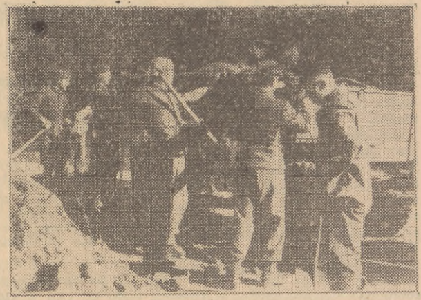
Spoleczeństwo Gdańska pomaga kierownictwu robót w przygotowaniu teatru do rozpoczęcia budowy. Roboty szybko posuwają się naprzód. W ubiegłą niedzielę pracowali żołnierze KBW.