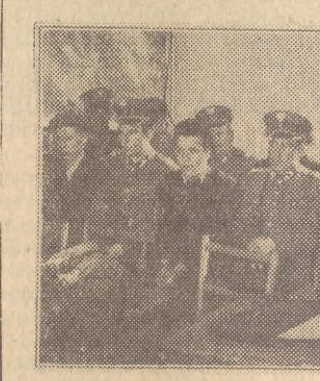
Na zdjęciu: ława oskarżonych w procesie o udział w napadzie zbrojnym na gmach Urzędu do Spraw Bezpieczeństwa Publicznego w Poznaniu.