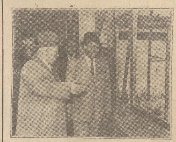
Na zdjęciu: N. S. Chruszczow zwiedza państwowe gospodarstwo rolne w Belje (Chorwacja).