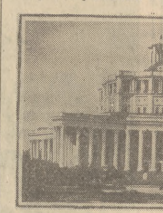
Centralny Teatr Armii Radzieckiej w Moskwie