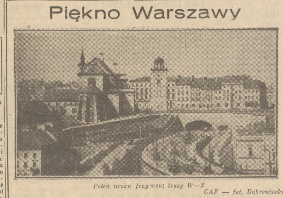
Pełen uroku fragment trasy W-Z CAF — fot. Dąbrowiecki

Miejscowością taką mogłaby być na przykład Genewa — oczywiście jeśli rząd szwajcarski ustosunkuje się do tego pozytywnie.