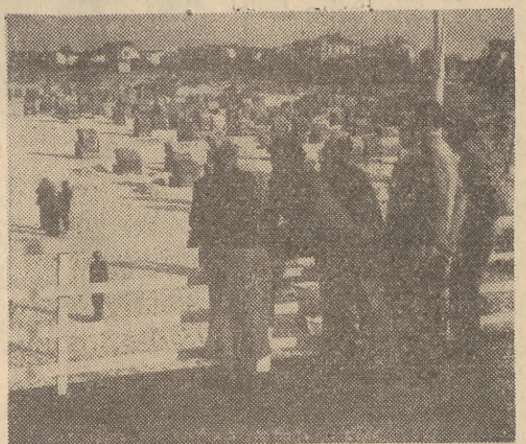
Plaża w Ahlbeck.

uważa wysyłkę wojsk francuskich na Cypr za posunięcie raczej polityczne niż wojskowe i pyta: „Jaka przypuszczalna korzyść polityczna kryje się za tym posunięciem? Sprzymierzamy się z mocarstwem kolonialnym, uważanym przez arabską opinię publiczną za mocarstwo szczególnie reakcyjne, wzmocniamy sprawę Nasseru w wypadku, gdyby sprawa Suezu została wniesiona na forum ONZ; sprawiamy wrażenie, że jesteśmy nastawieni raczej na dyktowanie niż na rozwiązanie sprawy w drodze rozmów. Przyznając nawet konieczność podjęcia wojskowych środków ostrożności, to ostatnie posunięcie wydaje się bezcelowe i nieuzasadnione.“