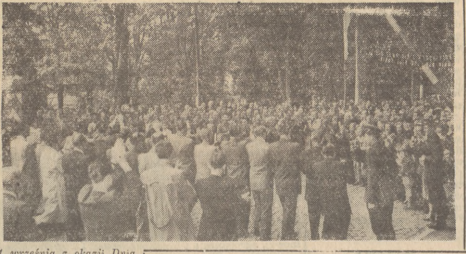
1 września z okazji Dnia Pokoju odbyło się w Goerlitz polsko - niemiecko - czeskie spotkanie przyjaźni. Na zdjęciu: 70-osobowa delegacja polska przekracza most graniczny, witań serdecznie przez mieszkańców.