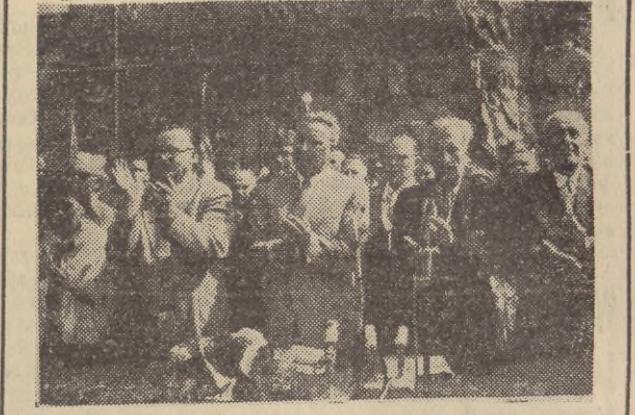
U stóp monumentalnego pomnika Czynu Powstańczego na Górze św. Anny odbyły się uroczystości, poświęcone 35 rocznicy wybuchu III Powstania Śląskiego. Na zdjęciu: na uroczystości przy był sekretarz KC PZPK — Edward Ochab.