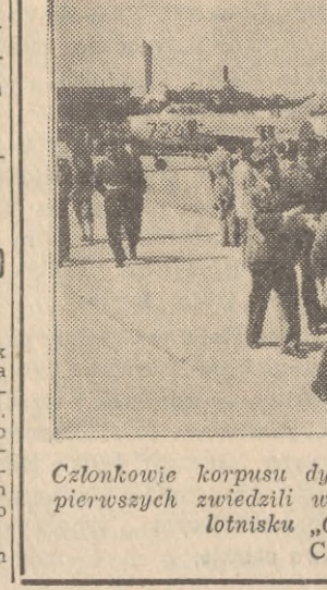
Członkowie korpusu dyplomatycznego jako jedni z pierwszych zwiedzili wystawę sprzętu lotniczego, na lotnisku „Okęcie“ w Warszawie.