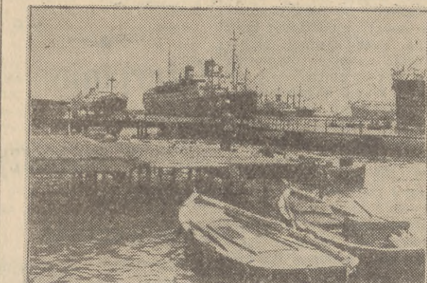
W Port Saeidzie formuje się konwój statków do Suez. Na zdjęciu: wśród nich „Batary”.

cający przewodniczącemu konferencji „przekazać rządowi egipskiemu kompletne sprawozdanie z obrad”. Co to znaczy? Znaczy to, że rząd egipski będzie mógł zapoznać się oficjalnie ze wszystkimi propozycjami, jakie w sprawie uregulowania problemu Kanalu Sueskiego zgłoszone były na konferencji londyńskiej. A wiadomo, że prócz propozycji mocarstw zachodnich, nazywanych później „planem Dullesa”, na konferencji londyńskiej rozpatrywano był również projekt delegata Indii, ministra Krzysny Menona, popar-