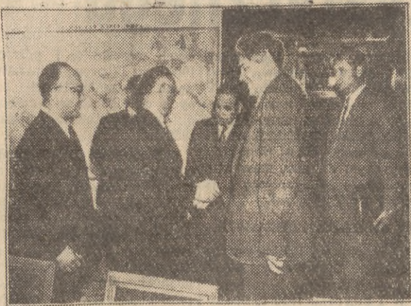
Na zdjęciu: Przewodniczący delegacji radzieckiej, minister spraw zagranicznych ZSRR D. T. Szepilow wymienia uścisk dłoni z przewodniczącym delegacji japońskiej, ministrem spraw zagranicznych Japonii M. Szigemitsu, w czasie jego wizyty u min. Szepilowa.