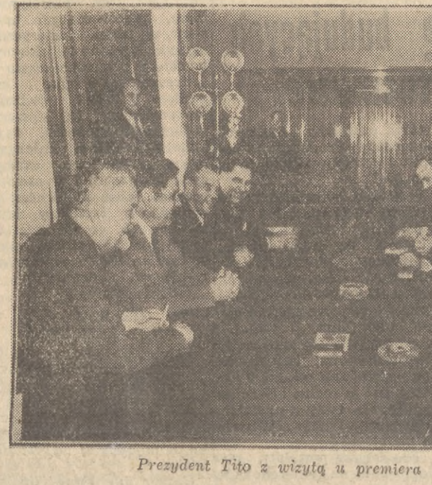
Prezydent Tito z wizytą u premiera Bułganina.