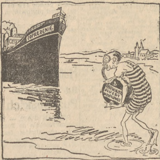
Bonn ma też swojego »Crabba«