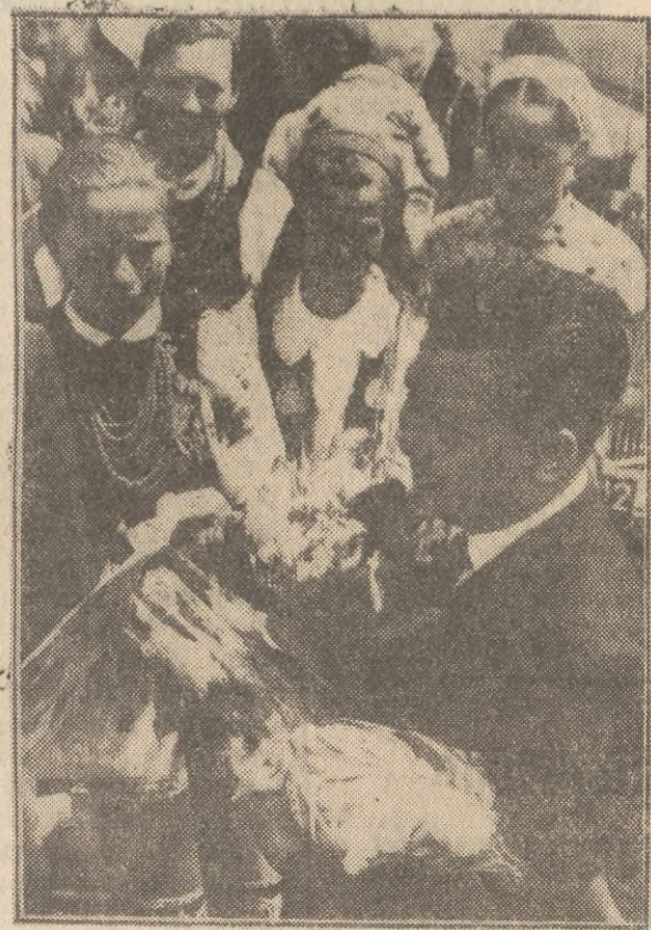
Księżę Kambodży wśród członków spółdzielni produkcyjnej.