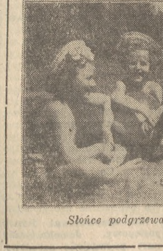
Słońce podgrzewa coraz mocniej...