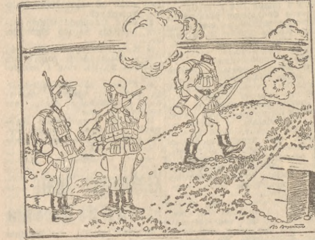
Leczenie zębów w służbie wojskowej: Tego to już zęby nie boją.

W związku z remilitaryzacją Niemiec zachodnich rząd niemiecki agituje młodzież niemiecką podkładać, że służba wojskowa gwarantuje żołnierzom również lepszą opiekę dentystyczną. (Z prasy) (Politiken, Kopenhaga)