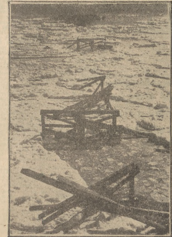
Zaledwie kilka dni temu w Zatoce Gdańskiej było pełno kory, jak widzimy na zdjęciu. W tej chwili już kry nie ma, ale nie ma również i moła w Orłowie. Pozostały jedynie szczątki