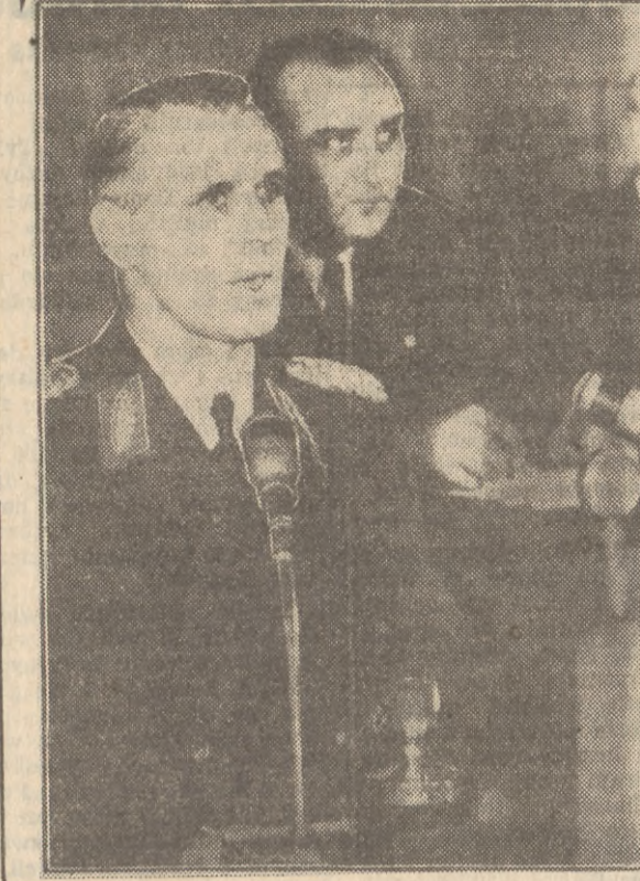
18.1. 1956 r. obradowała Izba Ludowa NRD. Na posiedzeniu popołudniowym Izba Ludowa NRD na wniosek Konwentu Sejmików rozpatrywała projekt „ustawy o utworzeniu Narodowej Armii Ludowej i Ministerstwa Obrony Narodowej”. Projekt ten uzasadnił wicepremier NRD Willi Stoph. Na zdjęciu: wicepremier Willi Stoph na trybunie.

Referat wicepremiera NRD Willi Stophy w Izbie Ludowej