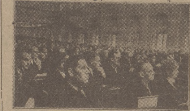
Na zdjęciu: fragment sali. Na pierwszym planie — członkowie delegacji Sejmu PRL.