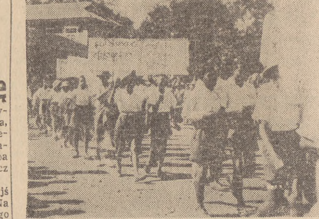
Fragment wielkiego pochodu manifestacyjnego z okazji święta narodowego w stolicy Burmy Rangunie. — Napisy na transparentach: „przec. z imperialistami” i „pokój dla wszystkich jest również pokojem dla nas”.

W wyzwolonym kraju rozkwitła nowe życie pod demokratycznymi rządami.