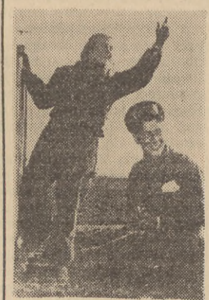
Na zdjęciu: młody traktorzysta ze swą pomocnicą przy pracy w sochozisz „Uroжайnyj” (Altaj).