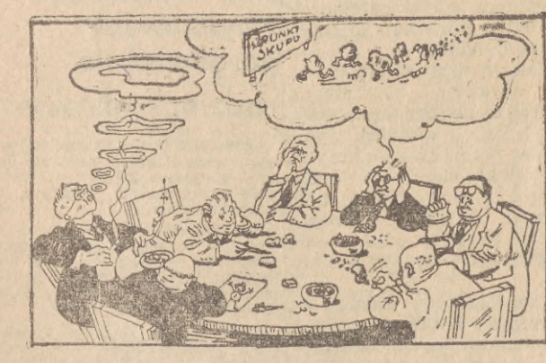
Ach, gdyby kartofle miały nogi i mogły same biegać, problem byłby bardzo łatwy do rozwiązania. (Daily Worker)