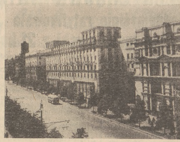
Na zdjęciu: Aleja Stalina