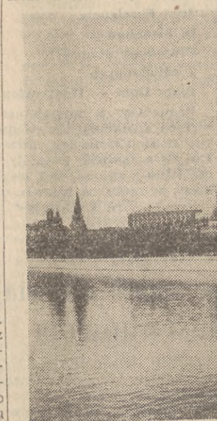
Widok na Kreml od strony mostu Moskoreckiego

Zwiedzanie zaczynamy od słynnej „Orużejnej Pałaty” — „zbrojowni”, która właściwie wcale nie jest zbrojownią. Zgromadzone w tym budynku tysiące